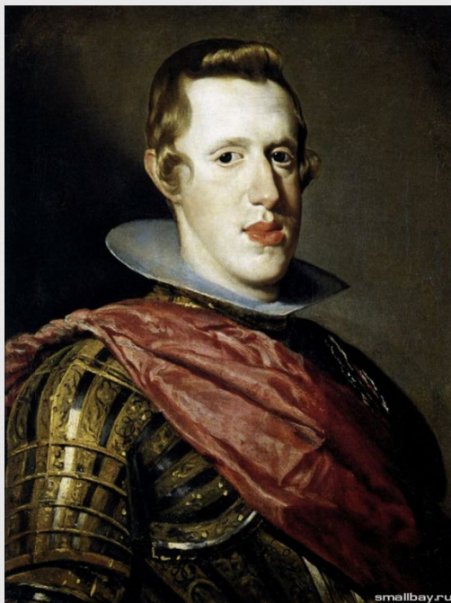
Хуан Мартинес Монтаньес, 1634