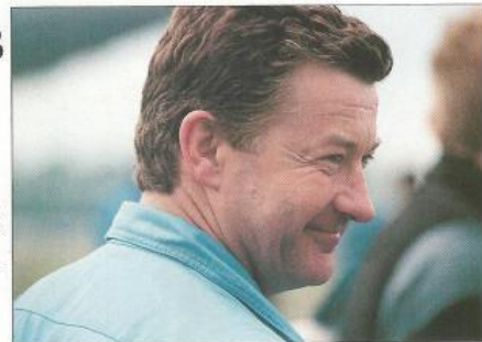
В. Пугачев всегда старался следовать своему правилу — не покидать самолет в воздухе, хоть и бывал на волосок от гибели. Так, в августе 2000 года при выполнении обычного испытательного полета на Су-33КУБ (внизу) разрушилась правая плоскость ПГО, обломки которой поскребли крыло, фюзеляж, кабину и возбудили взрыв двигателя, на самолете начался пожар. В. Пугачеву удалось погасить пожар и выпотыть аварийную посадку на аэродроме.