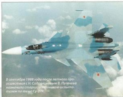
В сентябре 1989 года после летного происшествия в ст. Садовниковым В. Пугачева назначили старшим летчиком-испытателем по теме Су-27К.

В. Пугачев первым в России осуществил посадку самолета обычной схемы на корабль — 1 ноября 1989 года на ТАКР «Тбилиси» («Адмирал Кузнецов»). Во многом благодаря усилиям Пугачева продвигалась программа разработки двухместного палубного Су-27КУБ. В. Пугачев подал в число нескольких летчиков, работавших по программе рекордного П-42, он установил на этой машине семь мировых рекордов скороподъемности.