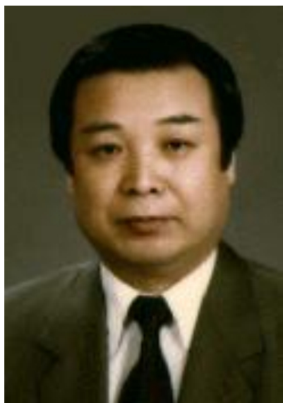
Разработал это направление корейский профессор Пак Чжэ Ву

Метод терапии су-джок основан на том, что каждому органу человеческого тела соответствуют биоактивные точки, расположенные на кистях и стопах. Воздействуя на эти точки, можно избавиться от многих болезней или предотвратить их развитие. Су-джок - это метод, проверенный исследованиями и доказавший свою эффективность и безопасность. Эта система настолько проста и доступна, что освоить ее может даже ребенок. Метод достаточно один раз понять, затем им можно пользоваться всю жизнь.