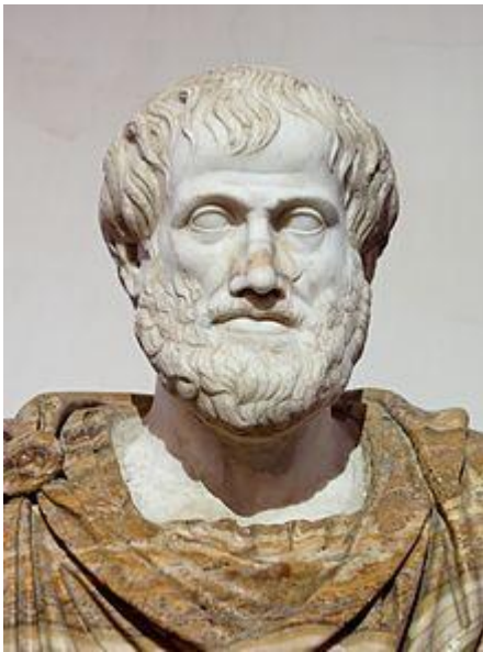
Аристотель 384 до н. э.

Все достижения в искусстве ораторства древности переняли маститые теоретики средневековья. Для завоевания внимания и любви публики они использовали различные приемы, среди которых: