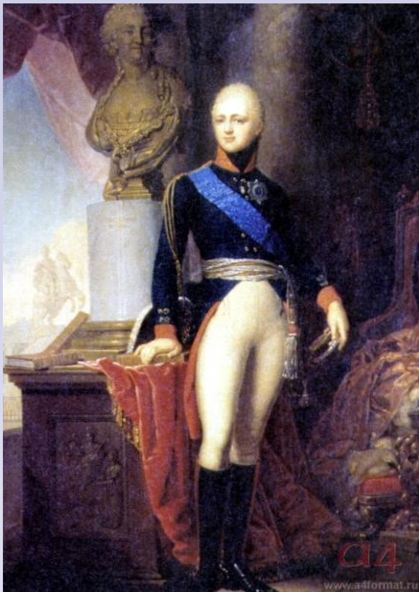
Император Александр 1- главнокомандующий в Аустерлицком сражении