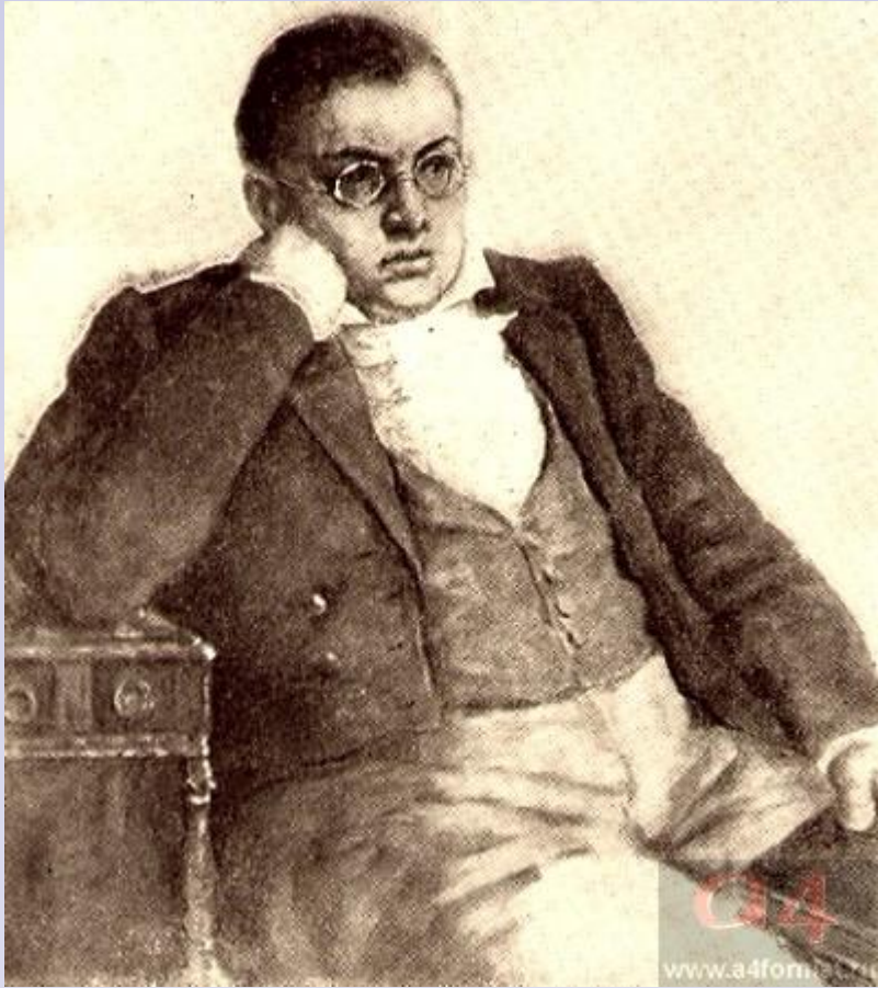
Пьер Безухов. Художник В. Серов

ШЕНГРАБЕНСКОЕ СРАЖЕНИЕ (РАЗРУШАЮТСЯ ПРЕДСТАВ- ЛЕНИЯ АНДРЕЯ О ВОЙНЕ, ГЕРОИЗМЕ...)