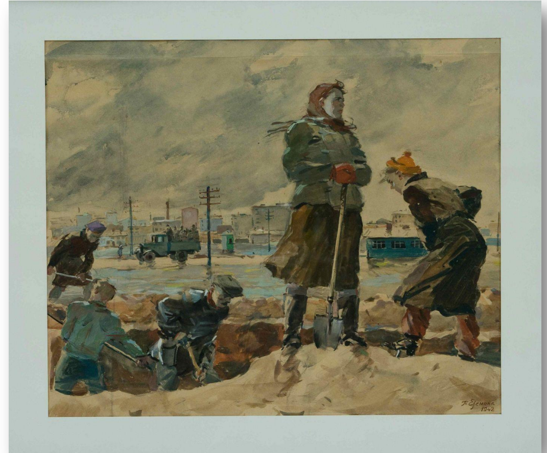
Т. Еремина из серии "Москва в годы войны"