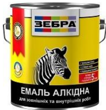
Эмаль ПФ-116 «ЗЕБРА»