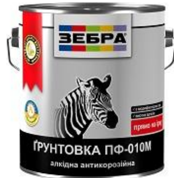
Грунтовка ПФ-010М «ЗЕБРА»