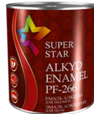
Эмаль ПФ-266 «Super Star»