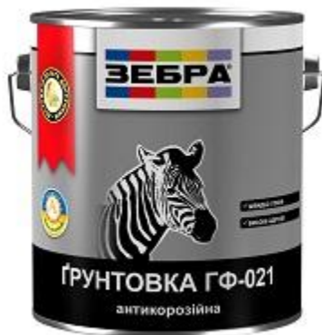
Грунтовка ГФ-021 «ЗЕБРА»