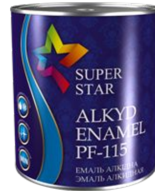
Эмаль ПФ-115 «Super Star»