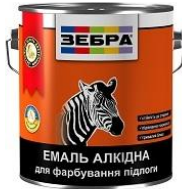
Эмаль ПФ-266 «ЗЕБРА»