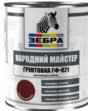
Грунтовка ГФ-021 «ЗЕБРА» сериї «Народный МАСТЕР»