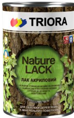
Лак акриловый «TRIORA»