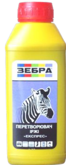
Преобразователь ржавчины «Экспресс» «ЗЕБРА»