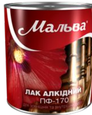
Лак ПФ-170 «МАЛЬВА»