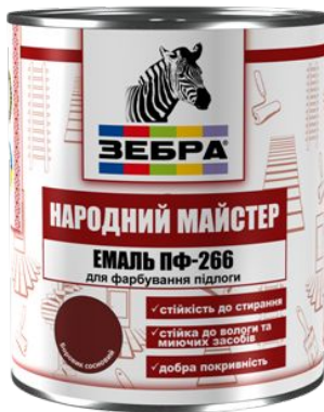
Эмаль ПФ-266 «ЗЕБРА» серии «Народный МАСТЕР»