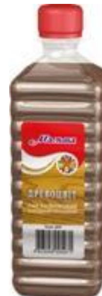
Лак цветной «Древоцвет» «МАЛЬВА»