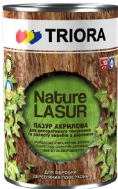
Лазурь акриловая «TRIORA»