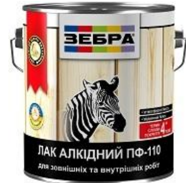
Лак ПФ-110 «ЗЕБРА»