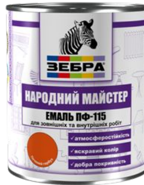
Эмаль ПФ-115 «ЗЕБРА» сери «Народный МАСТЕР»