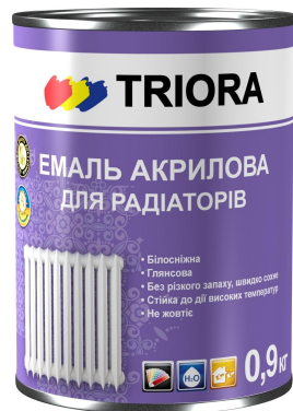
Эмаль для радиаторов «TRIORA»