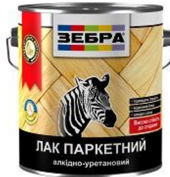
Лак паркетный «ЗЕБРА»