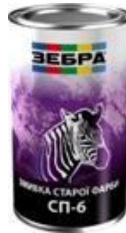
Смывка СП-6 «ЗЕБРА»