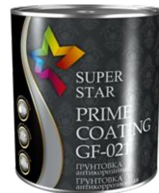
Грунтовка ГФ-021 «Super Star»