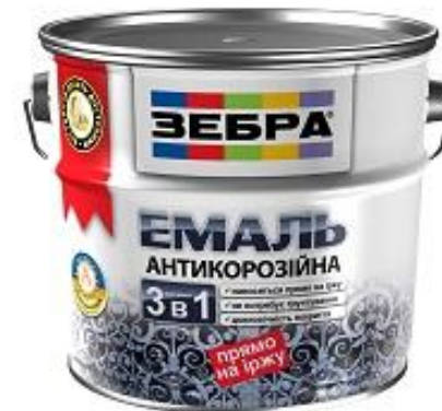
Эмаль антикоррозионная «ЗЕБРА»