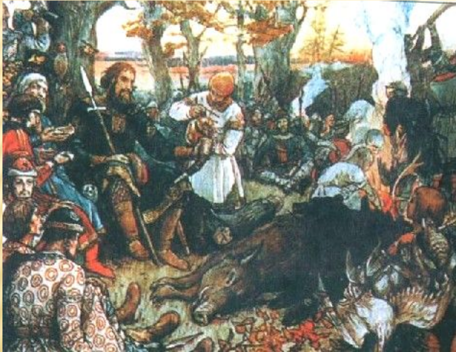
В.М. Васнецов Отдых Владимира Мономаха после охоты