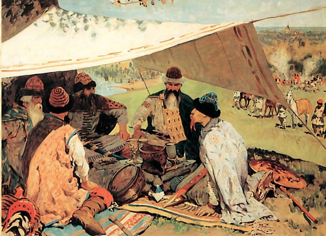
С. Иванов Съезд князей