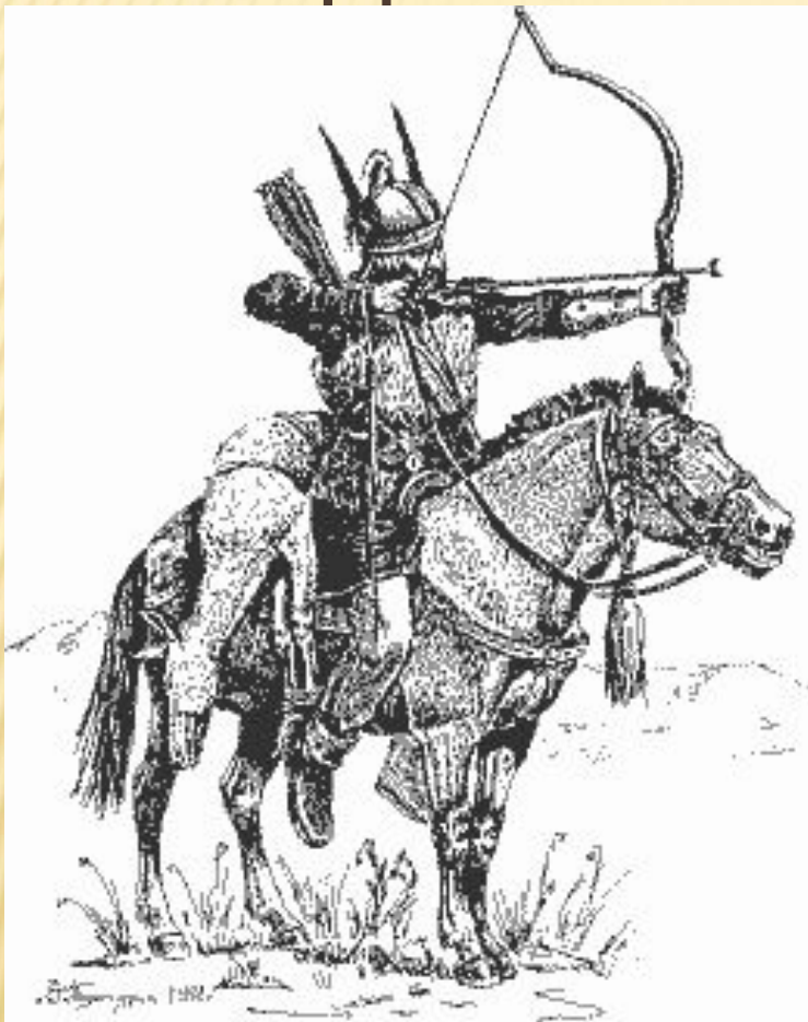
Половец . Реконструкция