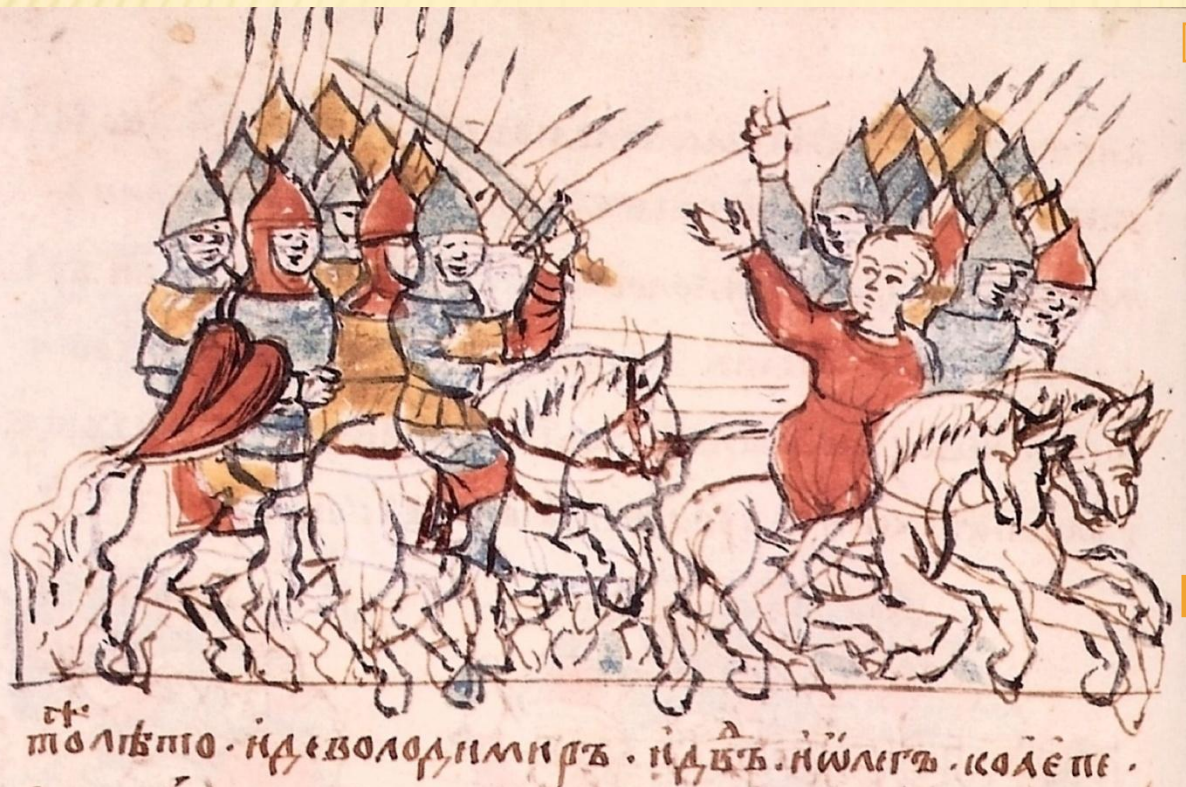
Преследование русскими войсками половцев до реки Хорол (1111 г.) Миниатюра Радзивилловской летописи

□ В 1103, 1107 и 1111 г. состоялись успешные общерусские походы против половцев.