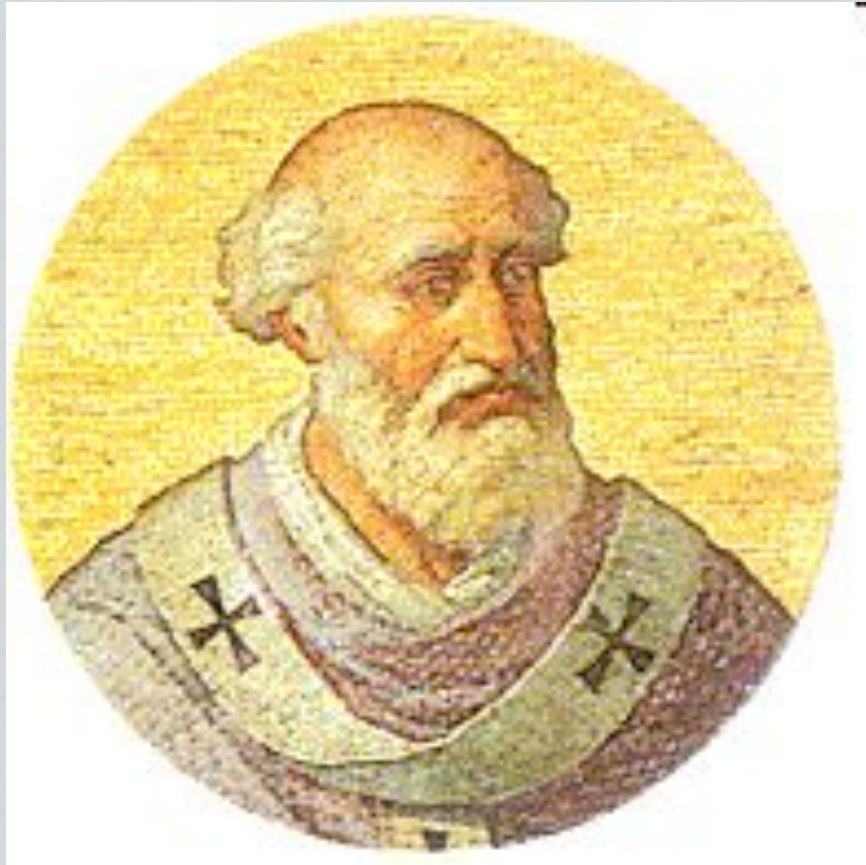
Папа Урбан II