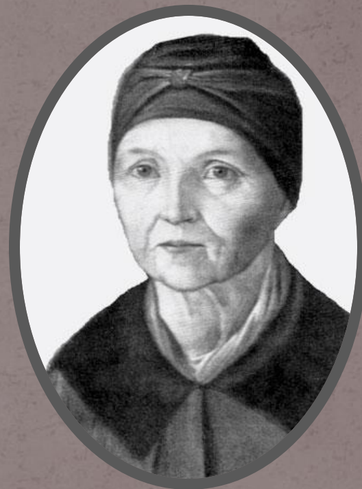
Матвеева (Яковлева) Арина Родионовна няня А.С.Пушкина