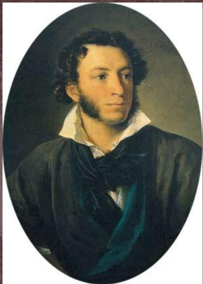
А.С. Пушкин В.А. Тропинина 1827 г.