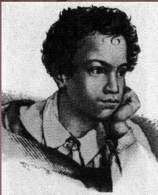
А.С. Пушкин в детстве. Гравюра Е. Гейтмана. 1822 г.

Он пишет небольшие стихи в альбомы соседских барышень. Взрослые не придают значения поэтическим упражнениям мальчика. До нас не дошло даже отрывков из этих ранних произведений Пушкина.