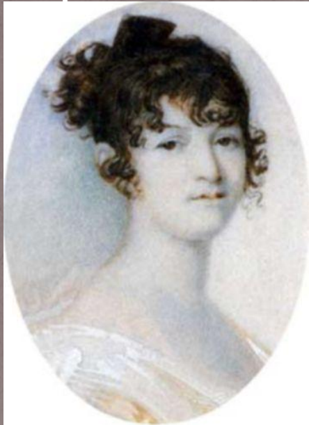
Надежда Осиповна Пушкина (Ганнибал)

Мать, Надежда Осиповна, урожденная Ганнибал, была внучкой Абрама Петровича Ганнибала — "арапа Петра Великого".