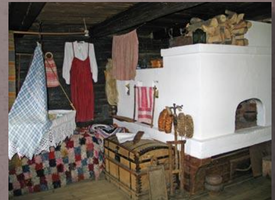
Дом няни Арины Родионовны