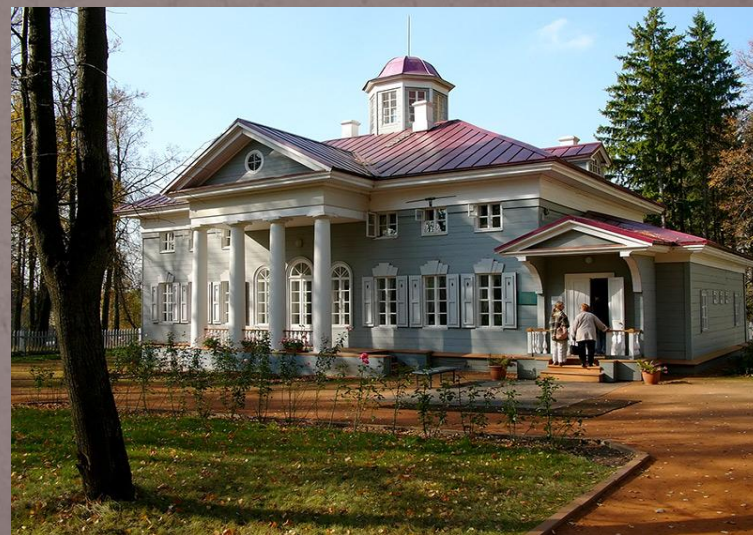
Дом бабушки М.А. Ганнибал

Летом Сашу увозили в Захарьино, подмосковную деревню бабушки. Мальчик любил эти места: и березовую рощицу, которая начиналась прямо у ворот захарьинского дома — здесь пили чай в жаркие дни, — и огромную липу у пруда, и темный еловый лес на другом его берегу. Он играл здесь, воображая себя богатырем, сражающимся со злыми силами. А по вечерам он вслушивался в веселые и грустные русские песни, смотрел на хороводы, которые водили крестьянские девушки.