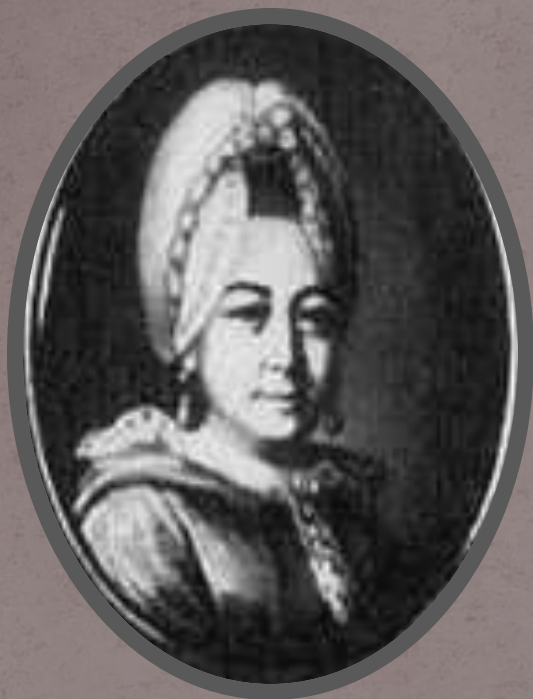
Мария Алексеевна Ганнибал бабушка А.С.Пушкина

Воспитанный французскими гувернерами, из домашнего обучения вынес прекрасное знание французского и любовь к чтению. Любовь к родному языку ему привили бабушка, Мария Алексеевна Ганнибал, превосходно говорившая и писавшая по-русски (явление редкое в дворянских семьях того времени), и няня Арина Родионовна.