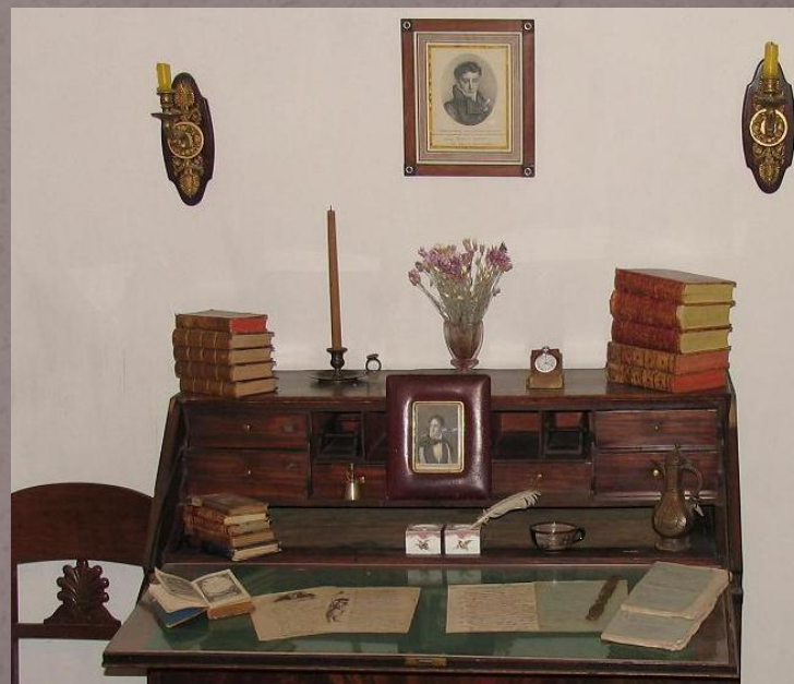
рабочее место Пушкина

Впечатления окружающего мира, литературной среды, книг переполняют душу ребенка. На восьмом году жизни он начинает писать, подражая Лафонтену, Вольтеру и Мольеру. Из-под его пера выходят басни, шуточные поэмы, комедии. Свою комедию “Похититель” он один “разыгрывает” перед сестрой.