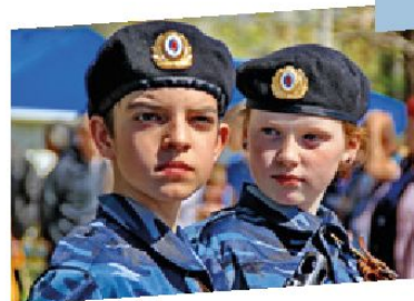
Юные друзья полиции