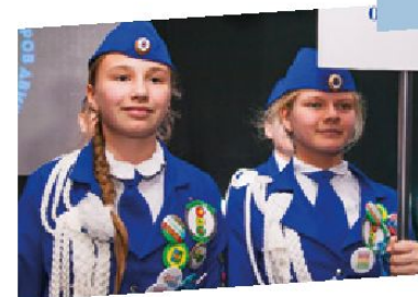
Юные инспектора движения