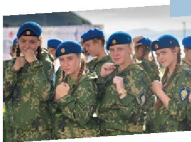
Курсанты военно-патриотического центра «Вымпел»