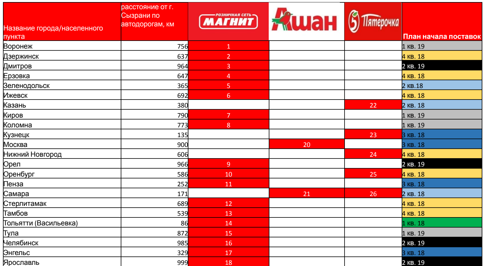
График выхода на проектные мощности