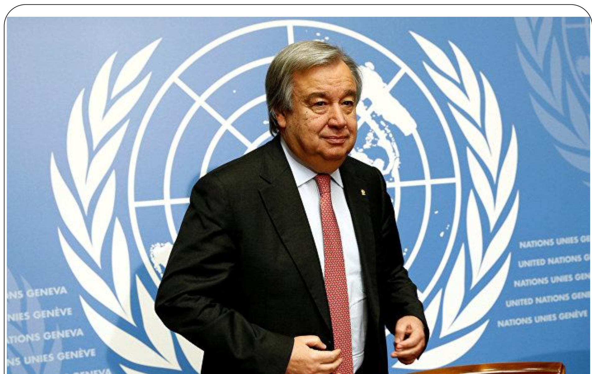
Генсек ООН Антониу Гутерреш на саммите китайско-африканского сотрудничества в Пекине