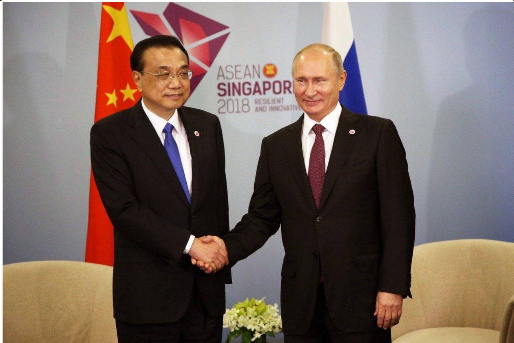
Владимир Владимирович Путин на Восточноазиатском саммите в Сингапуре