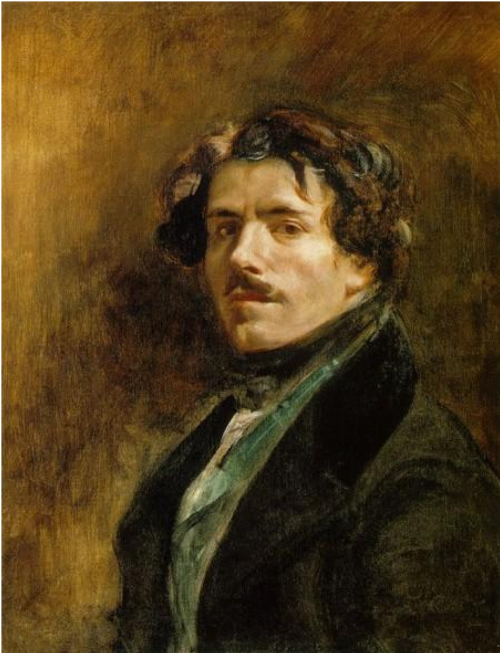
Автопортрет . Бл. 1837 Полотно, олія. 65 x 54,5