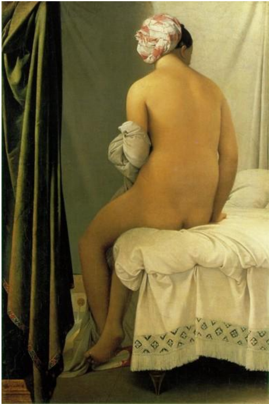
Купальниця . 1808 Полотно, олія. 146 x 97,5