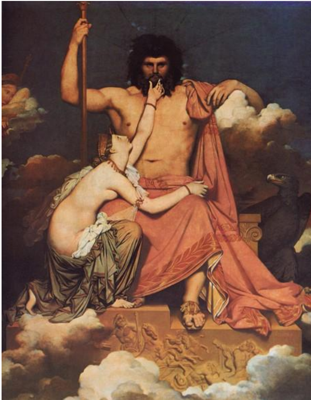
Юпітер і Фетіда . 1811 Полотно, олія. 327 x 260