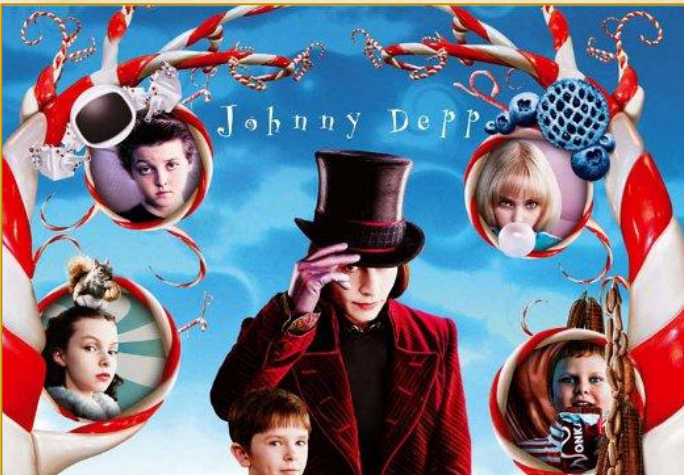
Р. Дал «Чарлі і шоколадна фабрика»