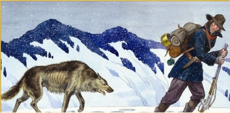
Джек Лондон. «Жага до життя»