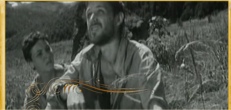
В.Биков. «Альпійська балада»