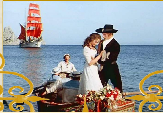
О.Грін «Пурпурові вітрила»