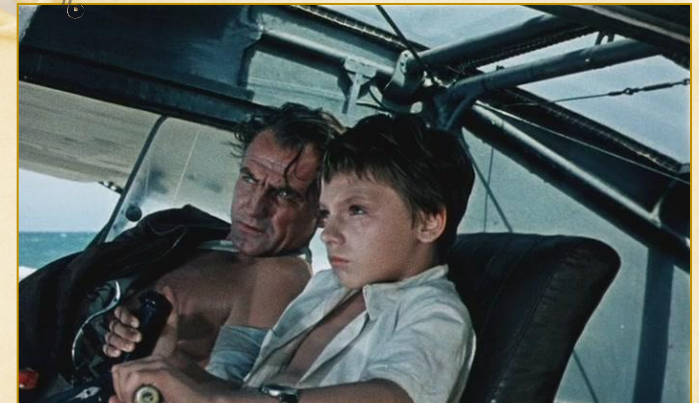
Олдрідж. «Останній дюйм»