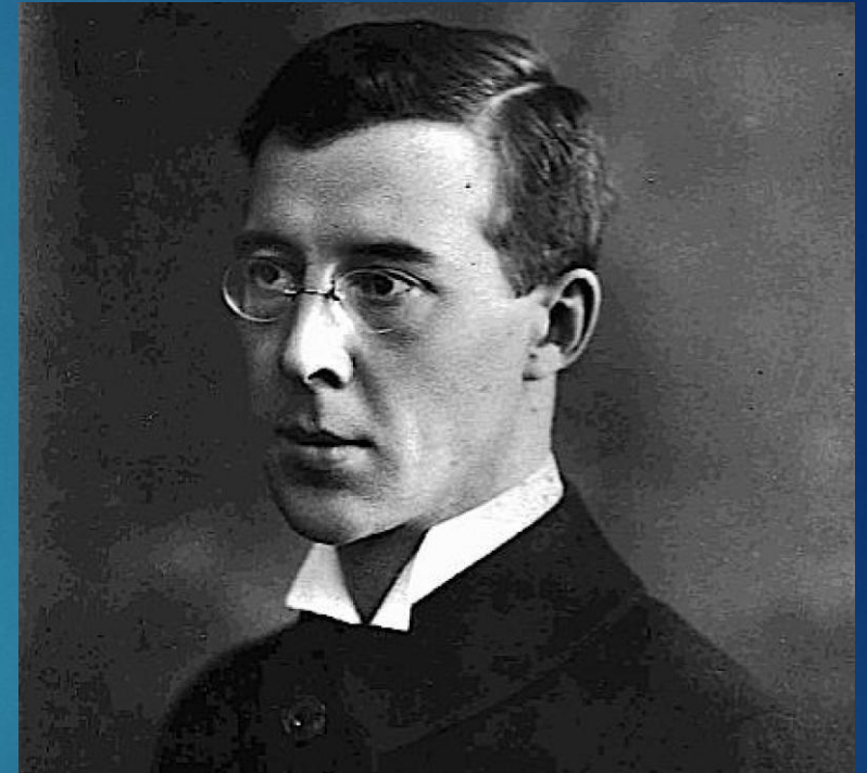
Сорокин Питирим Александрович

Отсюда следует, что социология управления - это специальная социологическая теория (теория среднего уровня), изучающая управление общественными системами как социальный процесс. В классической системе социологии П. Сорокина социальное управление входит в ее четвертый раздел — социальную политику (социальную медицину, или учение о счастье). Его задачей, по мнению П. Сорокина, является формулировка рецептов, указание средств, пользуясь которыми, можно и должно достигать цели улучшения общественной жизни и человека.