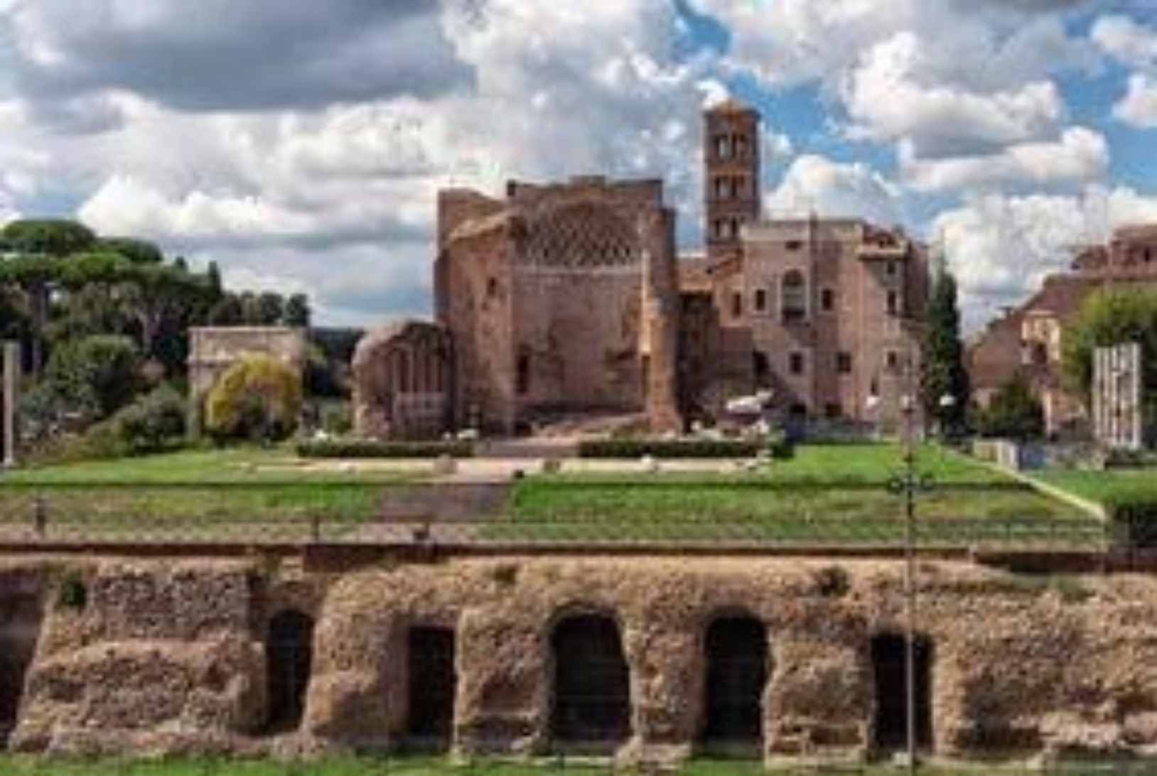
храм Венеры и Ромы (121 - 135), построенный по проекту самого Адриана., Рим