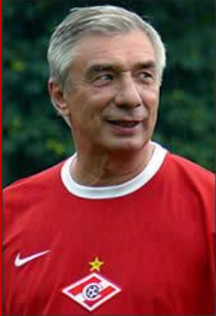
Ярцев Георгий Александрович. Нападающий Спартака. В 96-м году с пионеротрядом стал чемпионом России. Тренер сборной России 2003-2004 Знаменитое поражение от Португалии