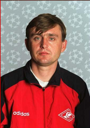
Черенков Федор Федорович Легенда футбола. Полузащитник Спартака. Любимец всех футбольных болельщиков Бронзовый призер Олимпиады -80 В списках 33 лучших футболистов СССР 9 раз В его честь названа одна из трибун Открытия Арены