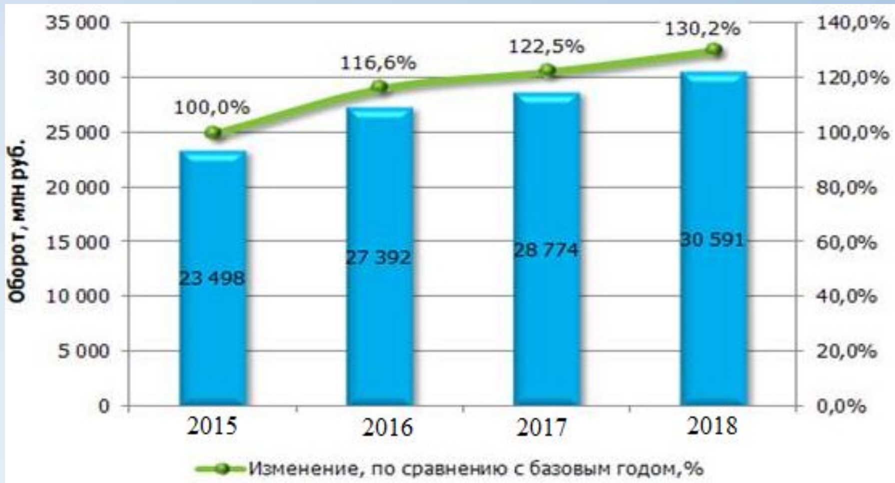
Рисунок 3 - Динамика оборота малого и среднего бизнеса в России с 2015 по 2018 гг., млн. рублей.