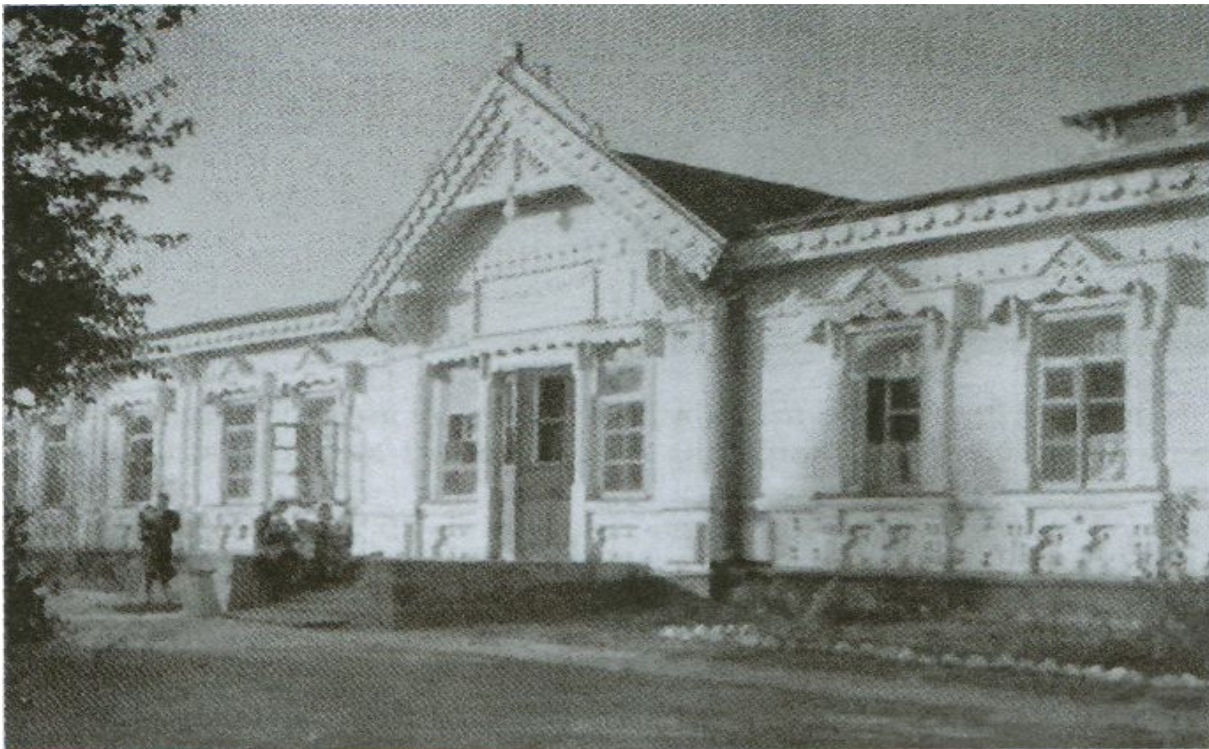
Будівля лікарні збудована за проектом В.Городецького 1905 року