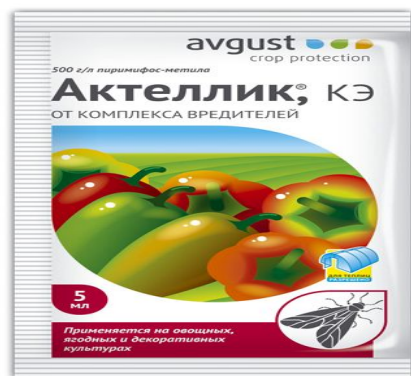
Актеллик (500 т.к.)

- жанама әсерлі инсектицидтер: қоймаларды, астық пен астық өнімдерін зарарсыздандыру үшін: