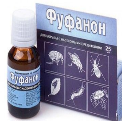
Фуфанон (57% т.к.)