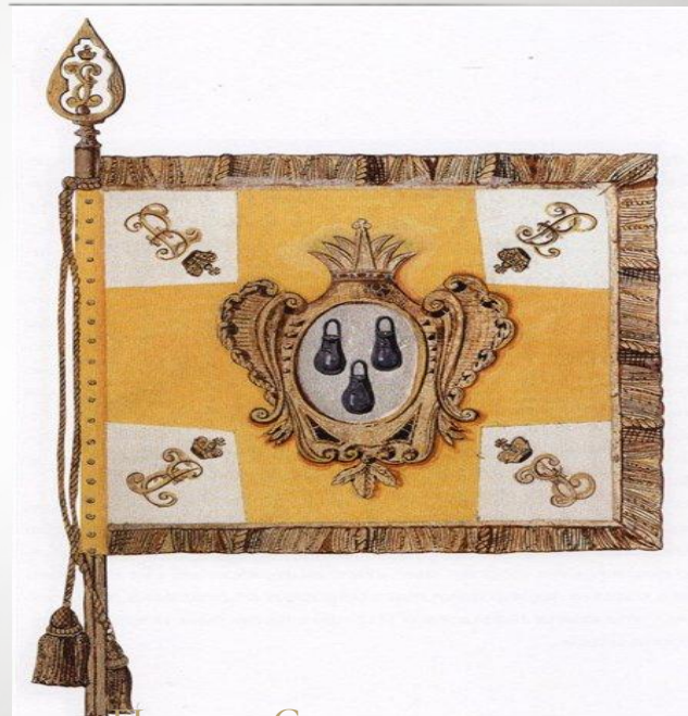
Прапор Сумського полку

У 1659 році Іван Виговський, який перейшов на сторону Польщі намагався заручитися підтримкою слобідських полків, оскільки Сумський полк був найбільшим, Виговський прислав листа Кондратьєву з пропозицією приєднатися до нього. У відповідь на це Герасим Кондратьєв, прилюдно розірвав листа, вигнав посланця зі словами «Виговський або дурний від природи, або одурів по смерті Богдана...». У відповідь на це розгніваний Іван Виговський послав у Сумський полк татар, які пограбували околиці міста, а саме місто брали в облогу, але взяти його не змогли.