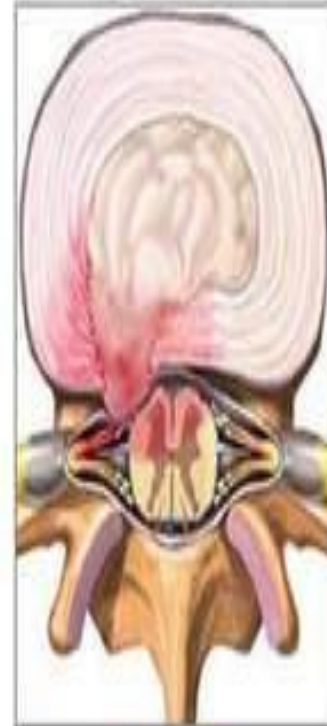
Грыжа межпозвонкового диска