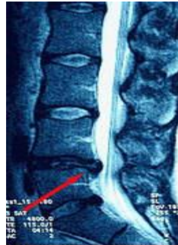
Магнитно-резонансная томография позвоночника Остеохондроз позвоночника

Формирование грыжи межпозвонкового диска