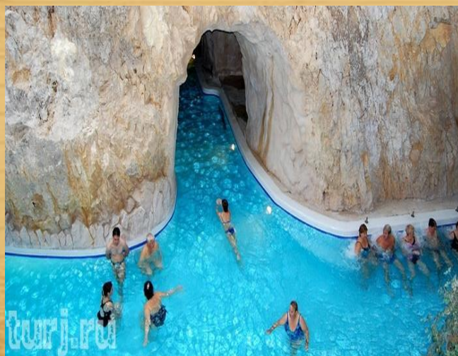
(Мишкольцтаполца: Купальни в пещере)