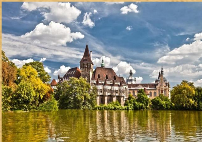
( Замок в Венгрии)