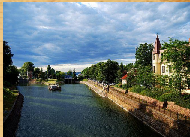
(Шиофок, Озеро Балатон)