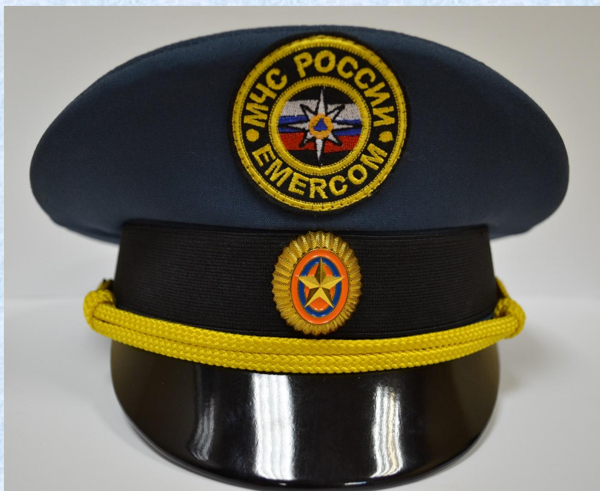
Фуражка летняя для старшего и среднего начальствующего состава

старший и средний начальствующий состав ФПС ГПС – фуражка летняя; младший начальствующий и рядовой состав ФПС ГПС – головной убор летний (кепи).