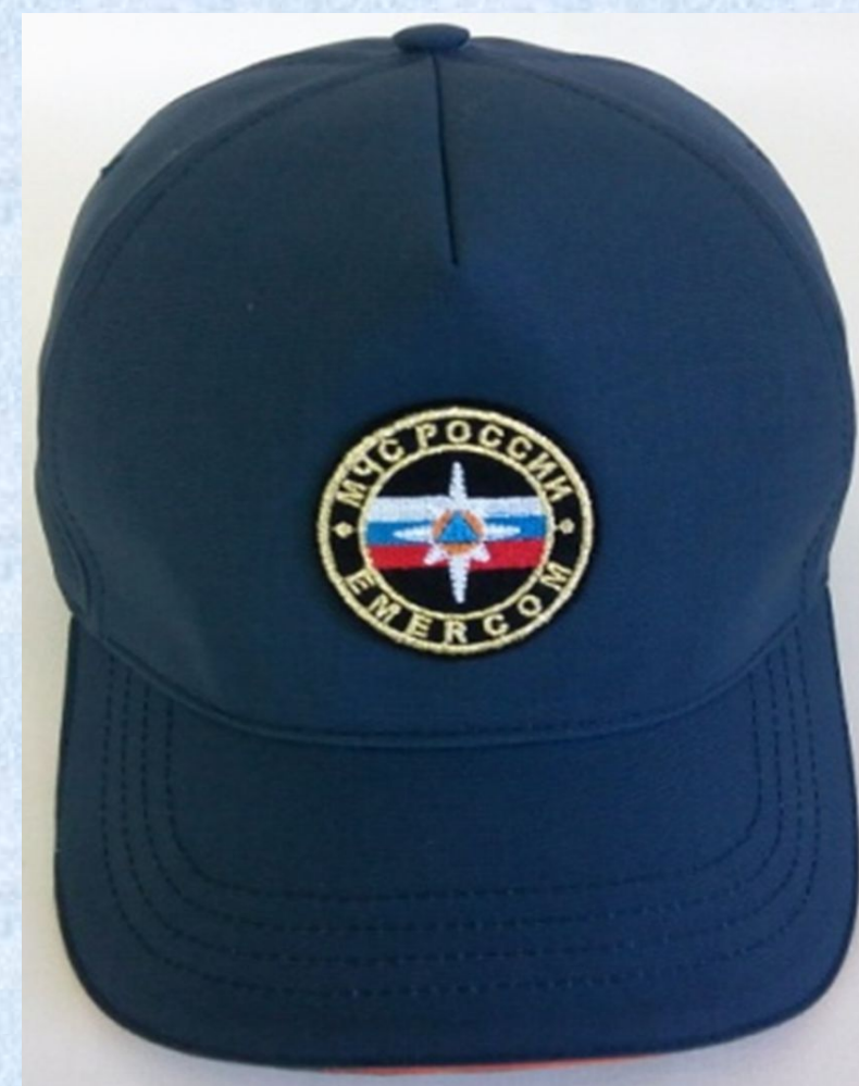
Головной убор летний (кепи) для младшего начальствующего и рядового состава