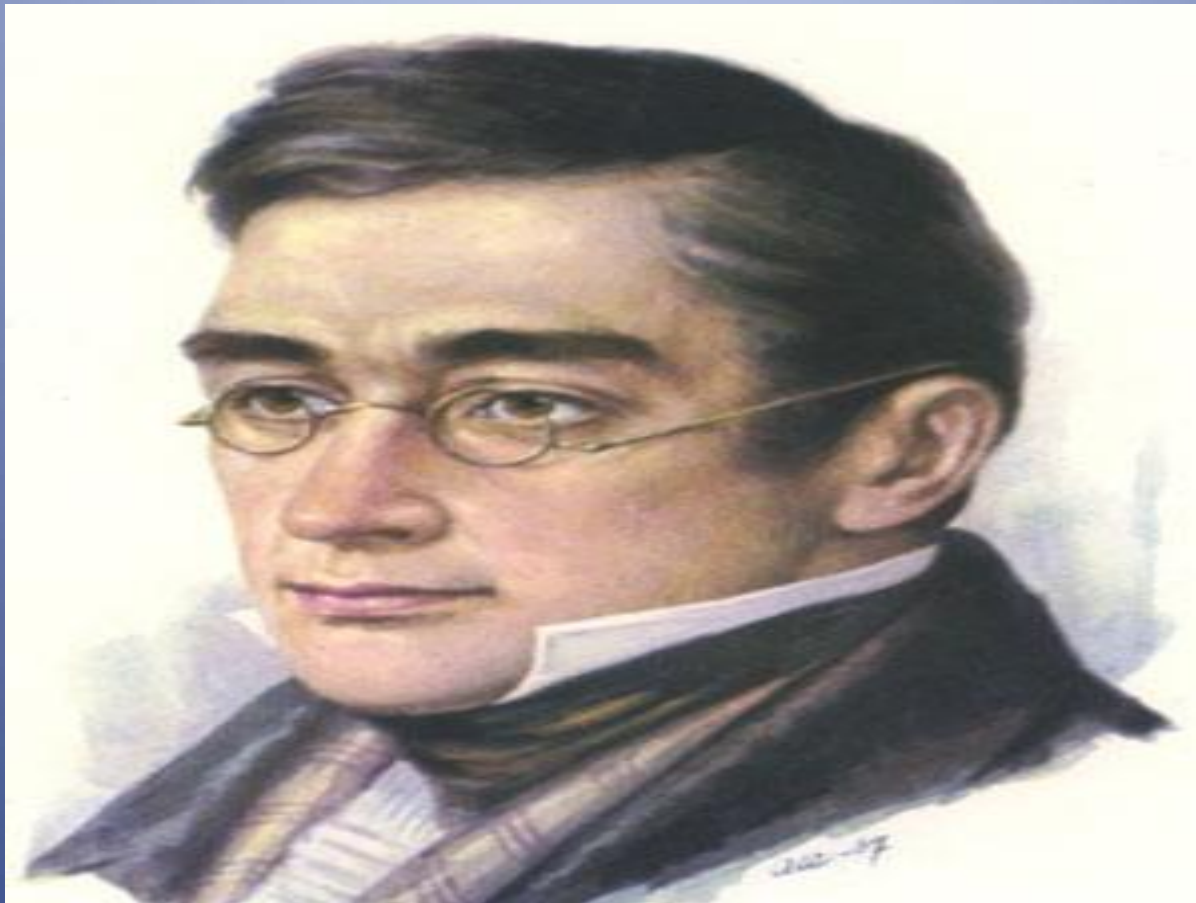
А.С. Грибоедов С портрета И. Крамского. 1873

Грибоедов принадлежит к самым могучим проявлениям русского духа.