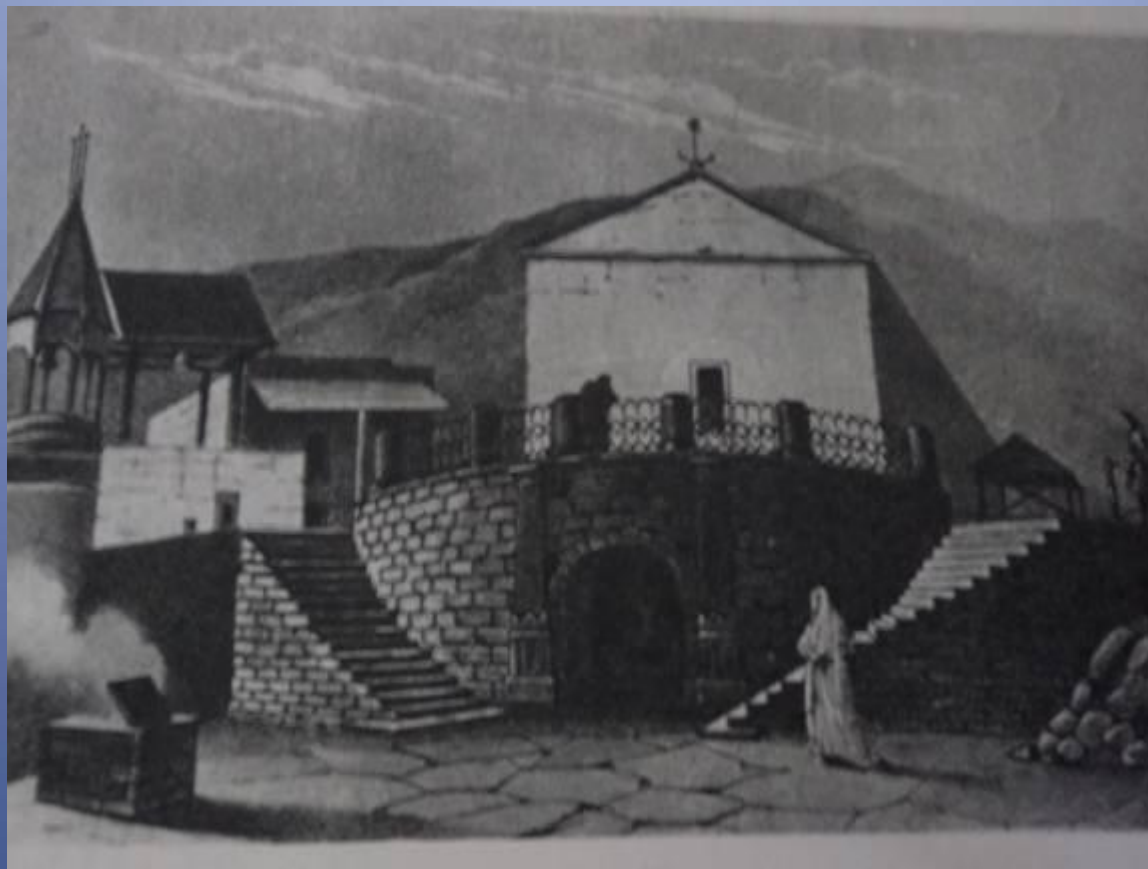
Могила Грибоедова на горе Мтацминда, в Тбилиси. С рисунка П.Бореля.

А.С. Грибоедова, согласно его желанию, похоронили в Грузии, в монастыре, расположенном на склоне горы Мтацминда, откуда открывается прекрасный вид на город Тифлис. Грибоедов очень любил это живописное место и называл его «пиитической (поэтической) принадлежностью Тифлиса».