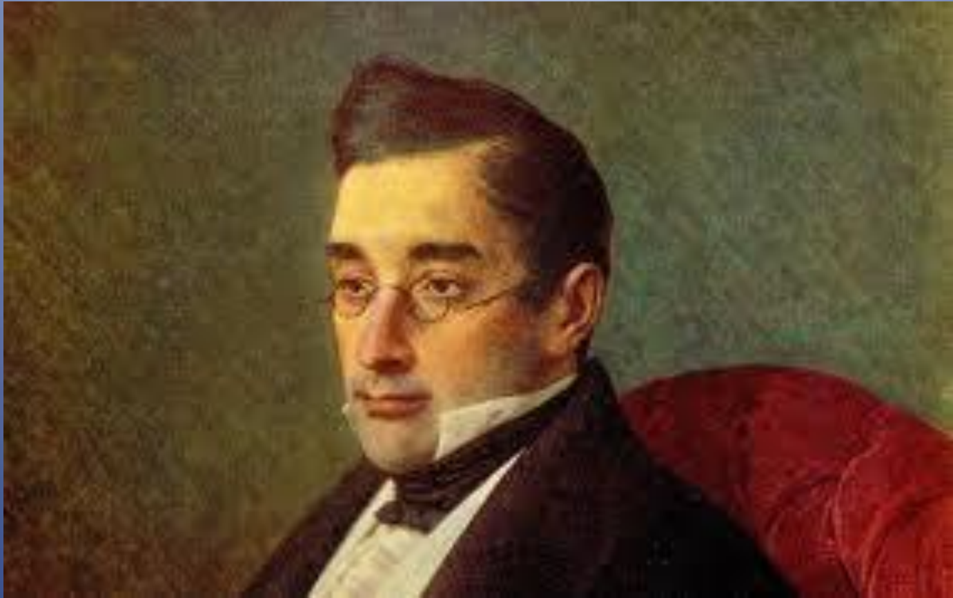
Жизнь и творчество А.С. Грибоедова