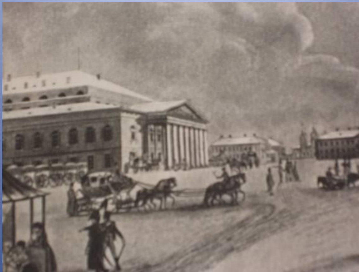
Большой театр в Петербурге в 1812 году. Здесь впервые ставились пьесы А.С. Грибоедова. С литографии. 1812

С 1814 года Грибоедов поселился в Петербурге и вскоре поступил на службу в Коллегию иностранных дел, где служил А. С. Пушкин и будущий декабрист – поэт В.К. Кюхельбекер. В эти годы Грибоедов увлекался театром, сам писал и переводил пьесы. Он глубоко интересовался общественной жизнью и за это время сблизился со многими будущими видными декабристами.