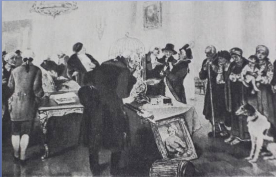
Продажа крестьян с аукциона. С картины К. Лебедева.