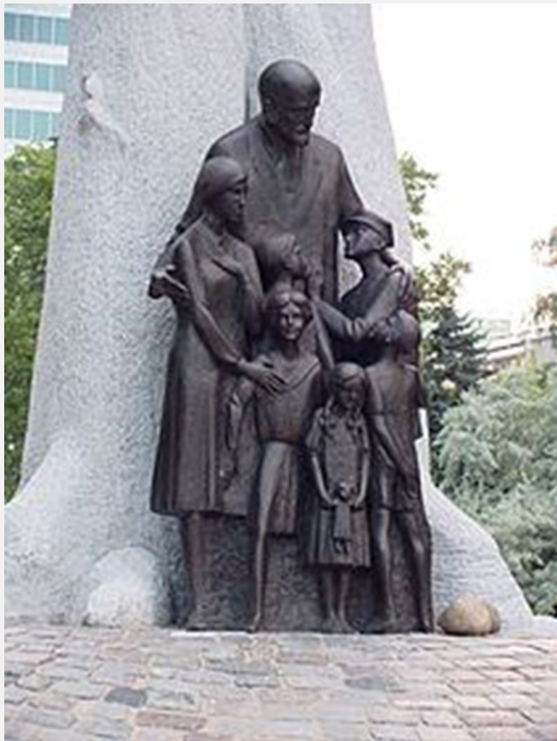
ПАМЯТНИК ЯНУШУ КОРЧАКУ В ВАРШАВЕ