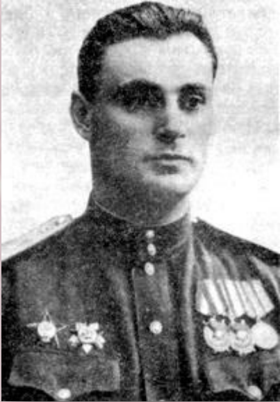
Войсковой авиаразведчик, майор