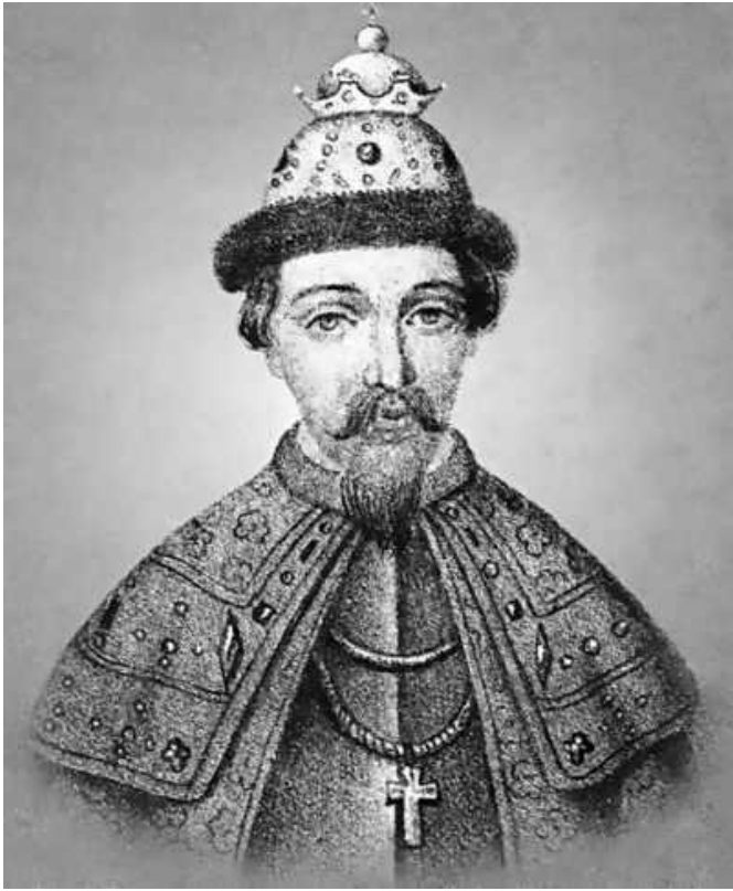
Семён Гордый (1317 - 1353)