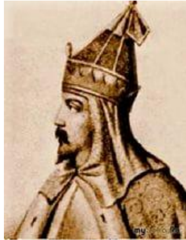
Иван II Красный (1353 - 1359)