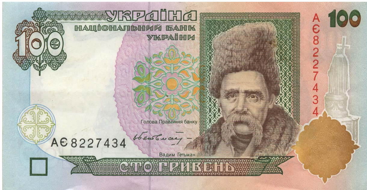
Зразок 1992 р.