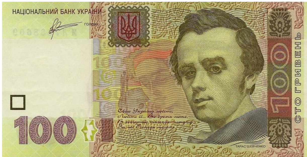
Зразок 2005 р.