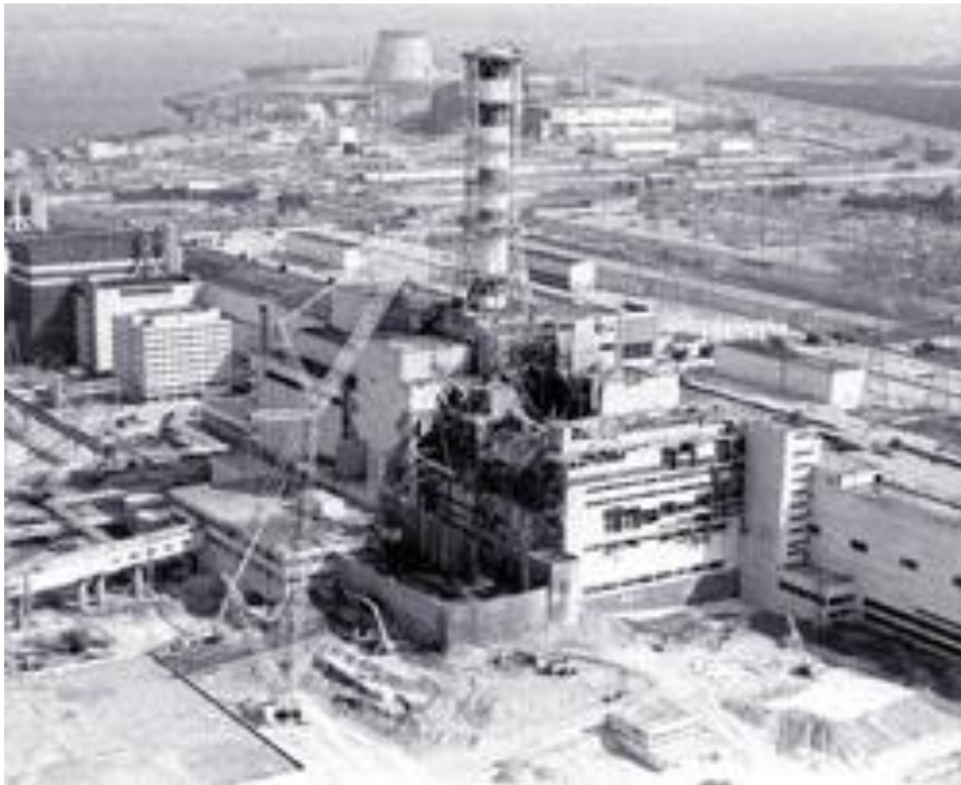
Один із перших знімків зруйнованого реактора Чорнобильської АЕС.