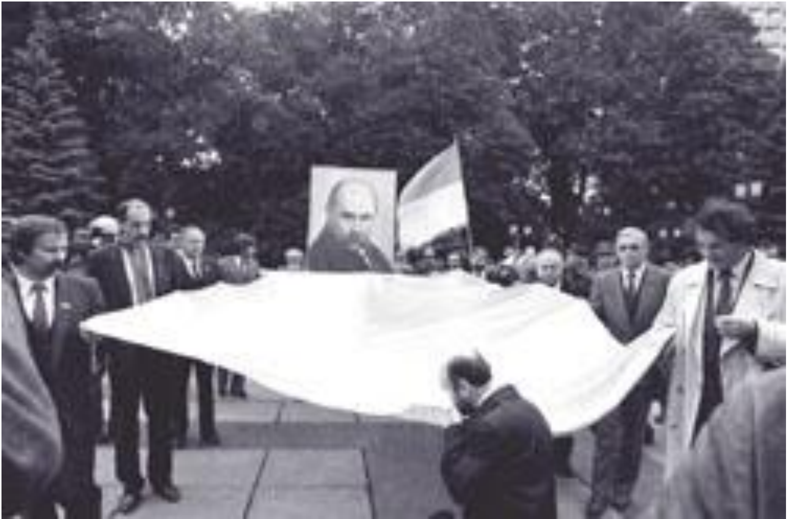
Київ. Біля будинку Верховної Ради України розгорнуто національний прапор. За мить його внесуть до зали.