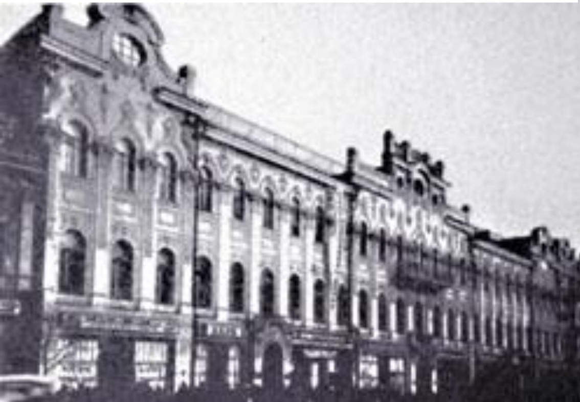
Будинок УТА на Хрещатику, 25.