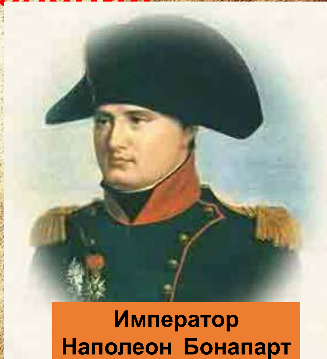
Император Наполеон Бонапарт