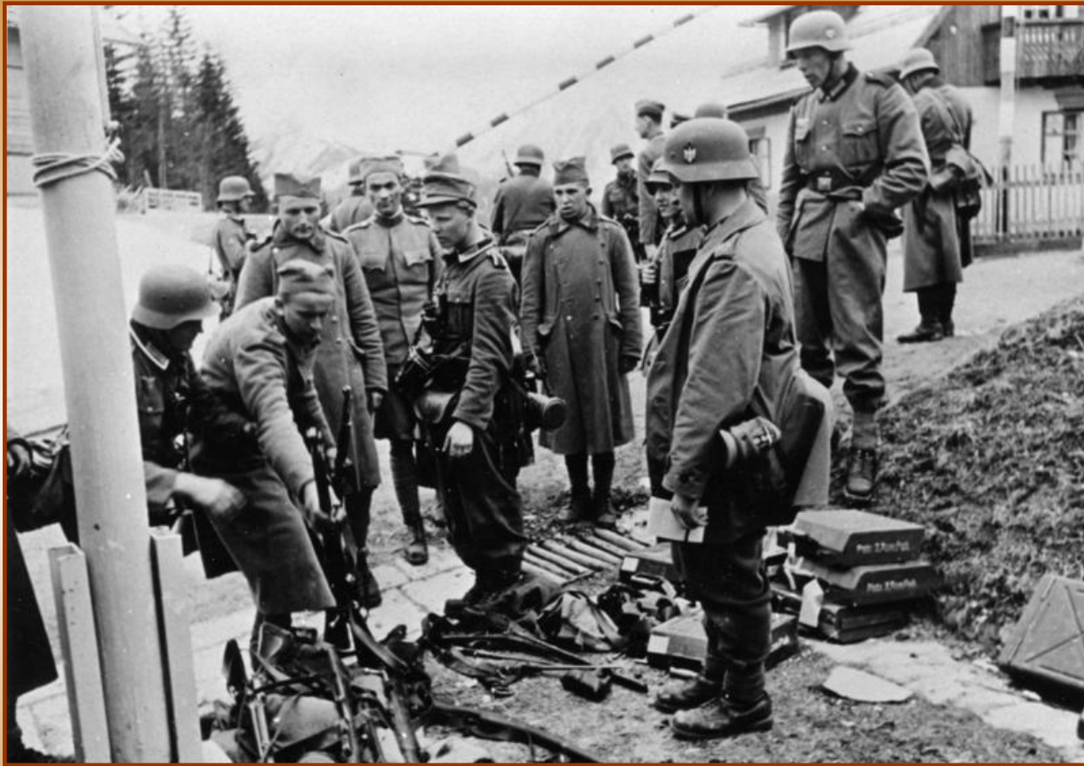
Югославские солдаты сдаются в плен

Италия вторглась в Грецию, но греки разбили врага. В апреле 1941 г. немецкие, итальянские, венгерские и болгарские войска вторглись в Грецию и Югославию. К концу апреля обе страны капитулировали.