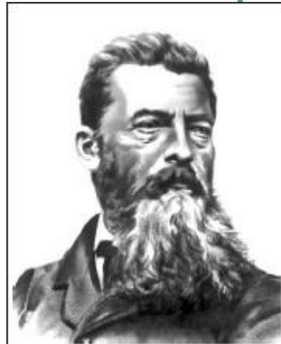
Людвиг Фейербах 1804 – 1872