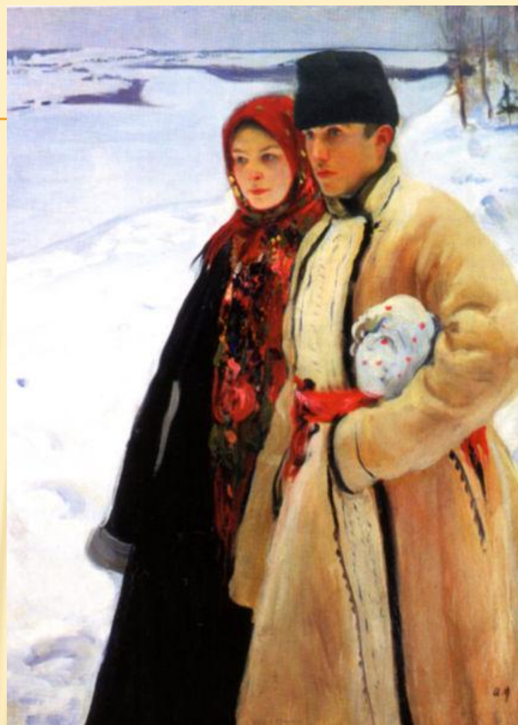
О.МУРАШКО. «ЗИМА». 1905