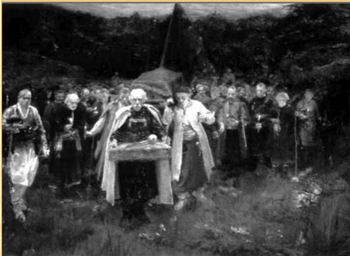
О.МУРАШКО. «ПОХОРОН КОШОВОГО». 1900

Отримавши початкову професійну підготовку, Олександр Мурашко вступив до Вищого художнього училища, що діяло при Петербурзькій Академії, через два з половиною роки став вільним слухачем цього навчального закладу. Мурашко стає студентом майстерні Іллі Рєпіна . Закінчивши навчання в Академії, Олександр Мурашко представив на конкурс твір «Похорони кошового», серед центральних персонажів художник зобразив славетного кошового Івана Сірка. Мурашко отримав за свою картину нагороду – золоту медаль і право навчатись за кордоном за рахунок Академії.