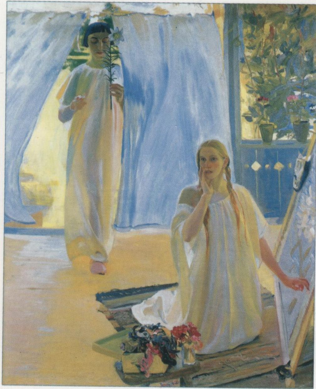
О.МУРАШКО. «БЛАГОВІЩЕННЯ». 1907