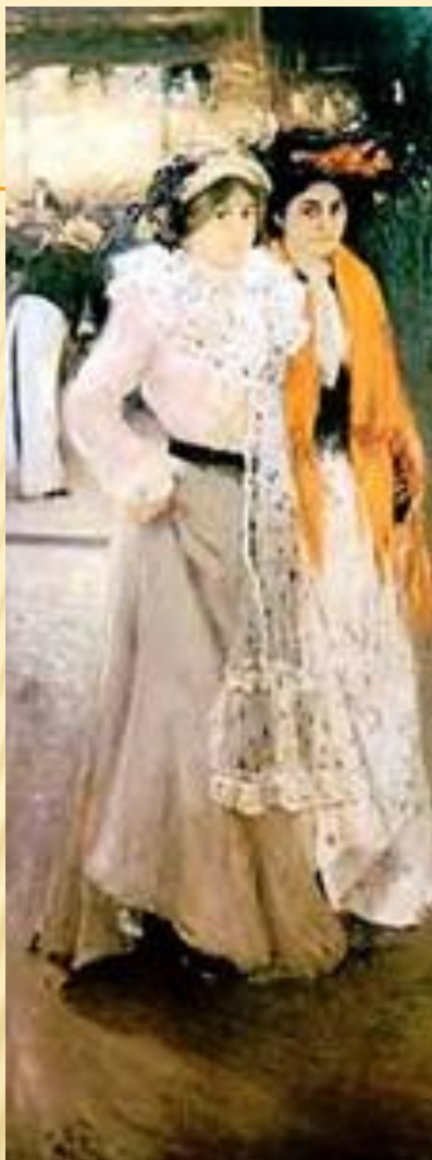
О. МУРАШКО. «ПАРИЖАНКИ. БІЛЯ КАФЕ». 1902.