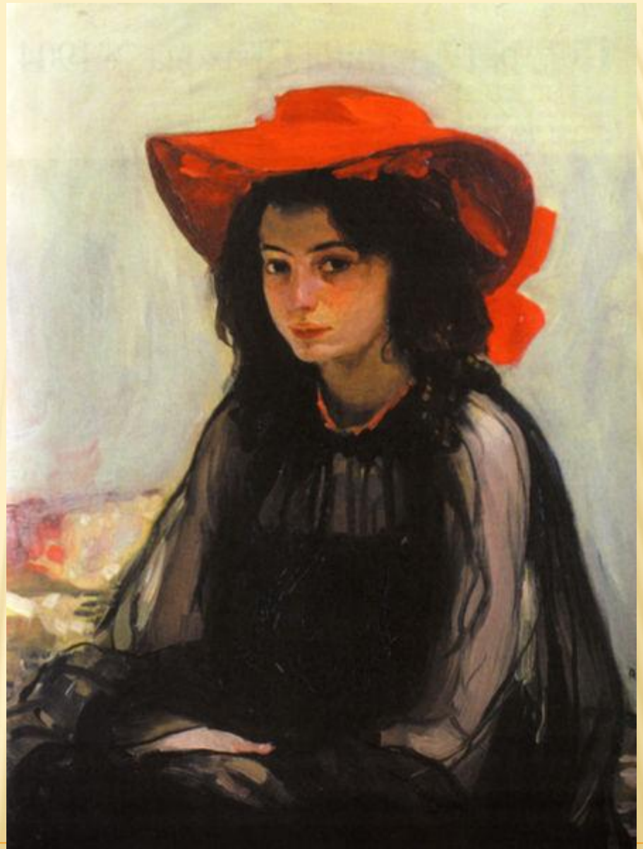
О. МУРАШКО. «ПОРТРЕТ ДІВЧИНИ У ЧЕРВОНОМУ КАПЕЛЮСІ». 1902-03