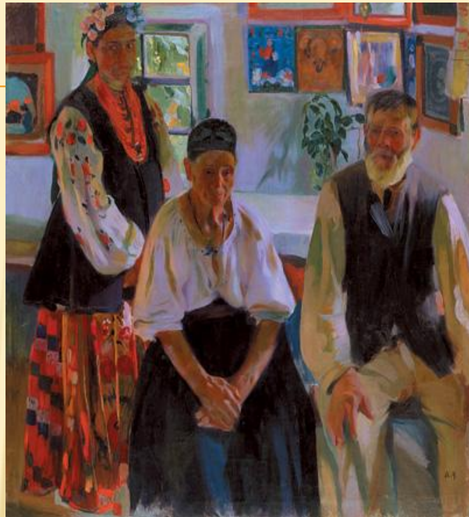
О.МУРАШКО. «СЕЛЯНСЬКА РОДИНА». 1914.