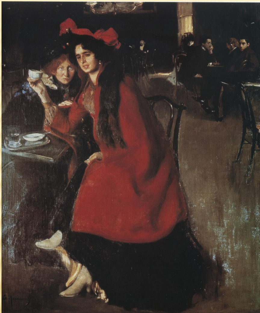
О.МУРАШКО. «У КАВ'ЯРНІ». 1902.