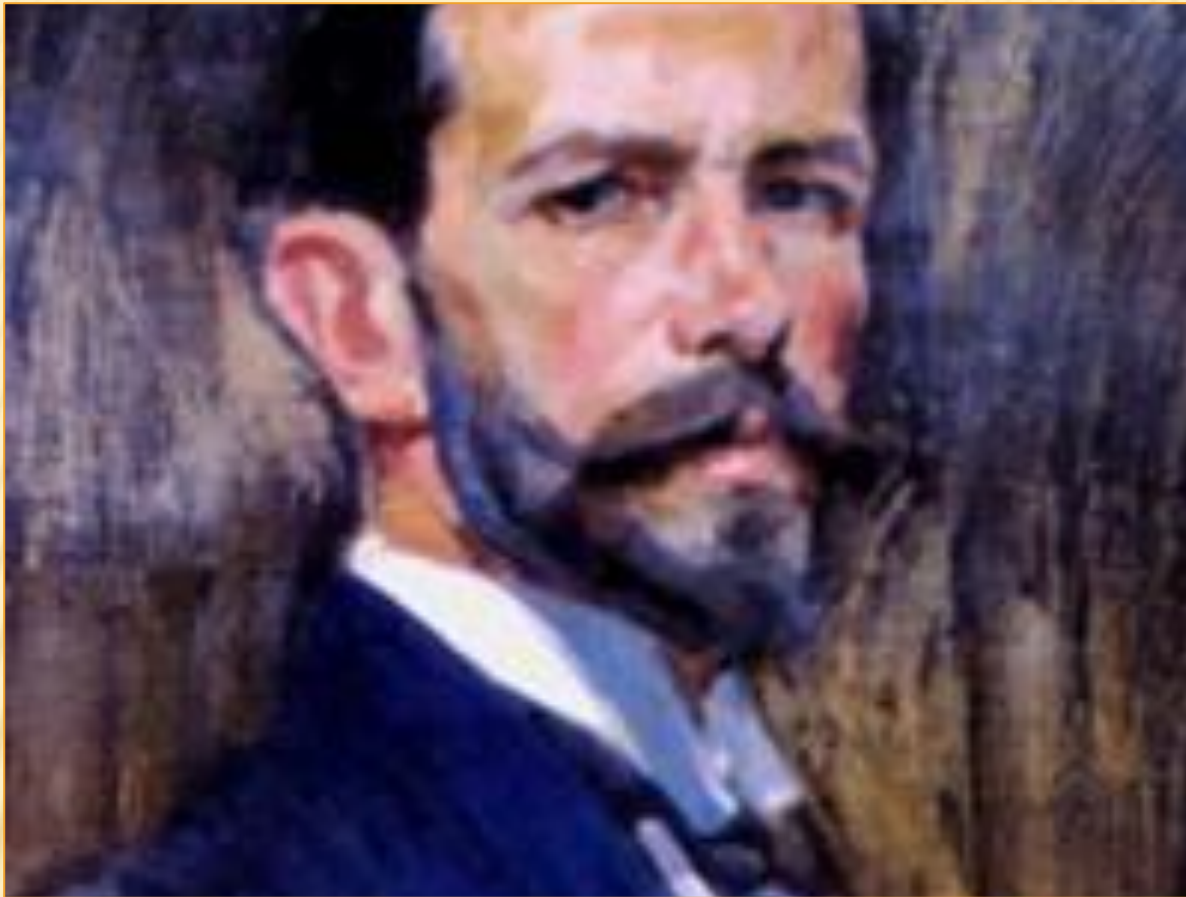
О.МУРАШКО. «АВТОПОРТРЕТ». 1918..

Олександр МУРАШКО (1875-1919) – гордість українського образотворчого мистецтва, чудовий живописець, вправний портретист. Один з небагатьох українських художників, що зумів органічно поєднати кращі надбання французького імпресіонізму, елементи модерну і ґрунтовну реалістичну школу Петербурзької Академії мистецтв, створивши свій неповторний мистецький стиль. Олександр Мурашко - художник, мистецтво якого «народжувалось на зламі епох», коли митці докорінно переосмислювали естетичні ідеали і погляд на закони творчості.