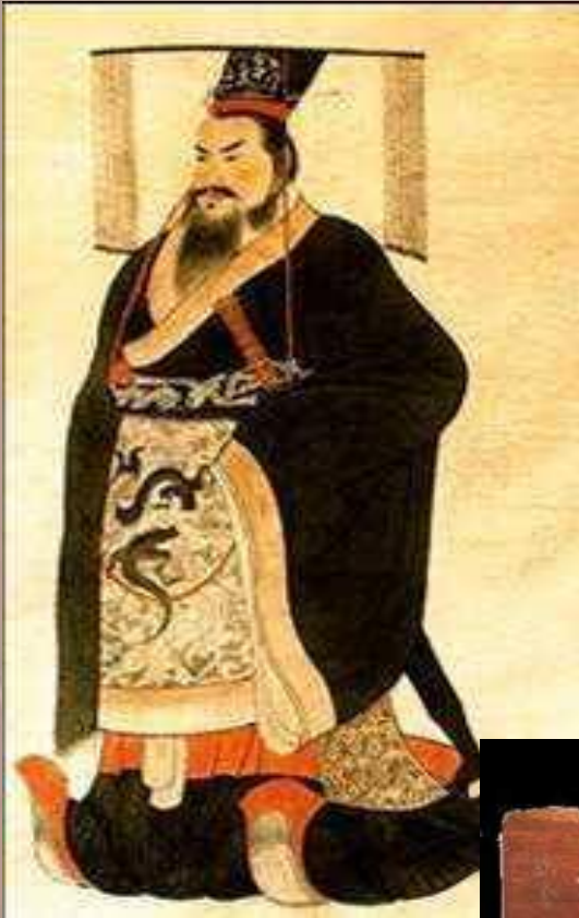
Конфуций (551-479 гг. до н. э.)