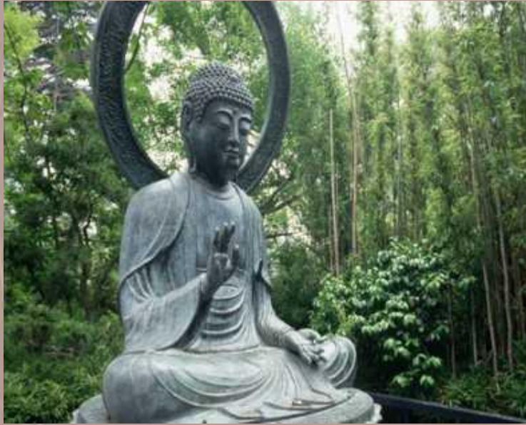
Будда (623-544 гг. до н. э.)