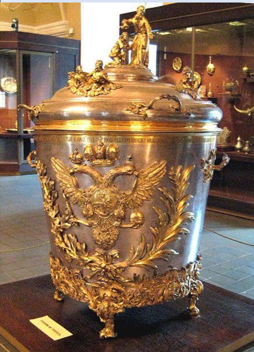
"Кадь" для хранения мира (XVIII в.)

Миро готовится из чистого еля (оливкового масла) с добавлением белого виноградного вина и многих благовонных веществ. В настоящее время в состав мира входит около 40 веществ.