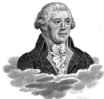
Bürger, 1771 BÜRGER

На первое место выдвигается идея наказания лжи, а сама книга построена как типично английское произведение, где все события связаны с морем.