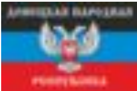
Донецкая Народная Республика