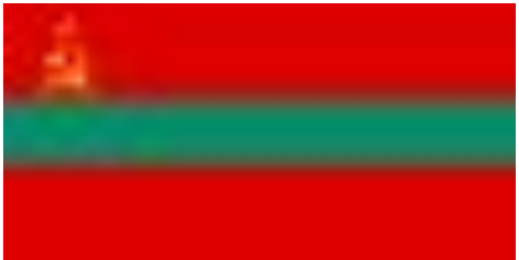
Приднестровская Молдавская Республика