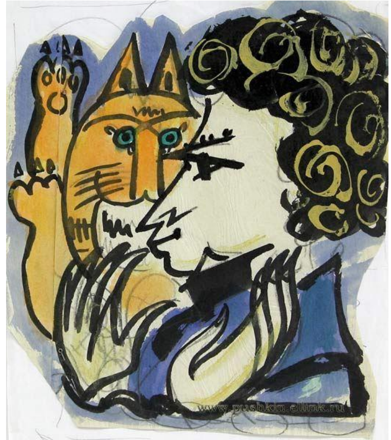
Т. Маврина. А. С. Пушкин и кот учёный. Лукоморье. Эскиз