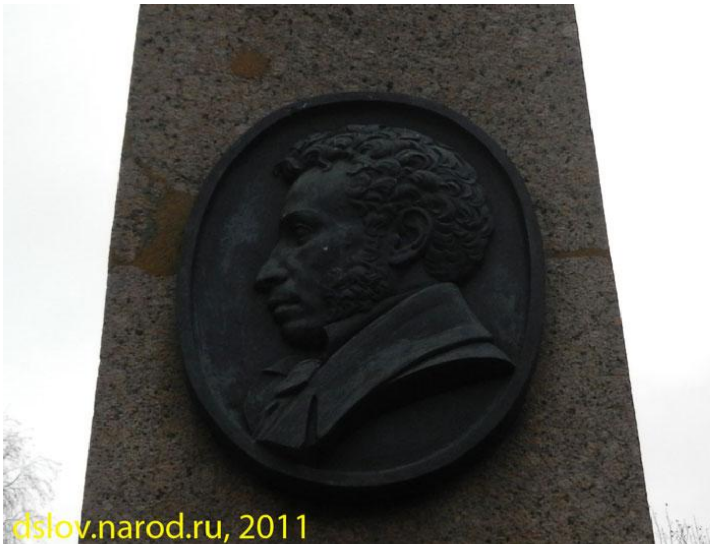
Место дуэли Пушкина у Черной речки (Санкт-Петербург)