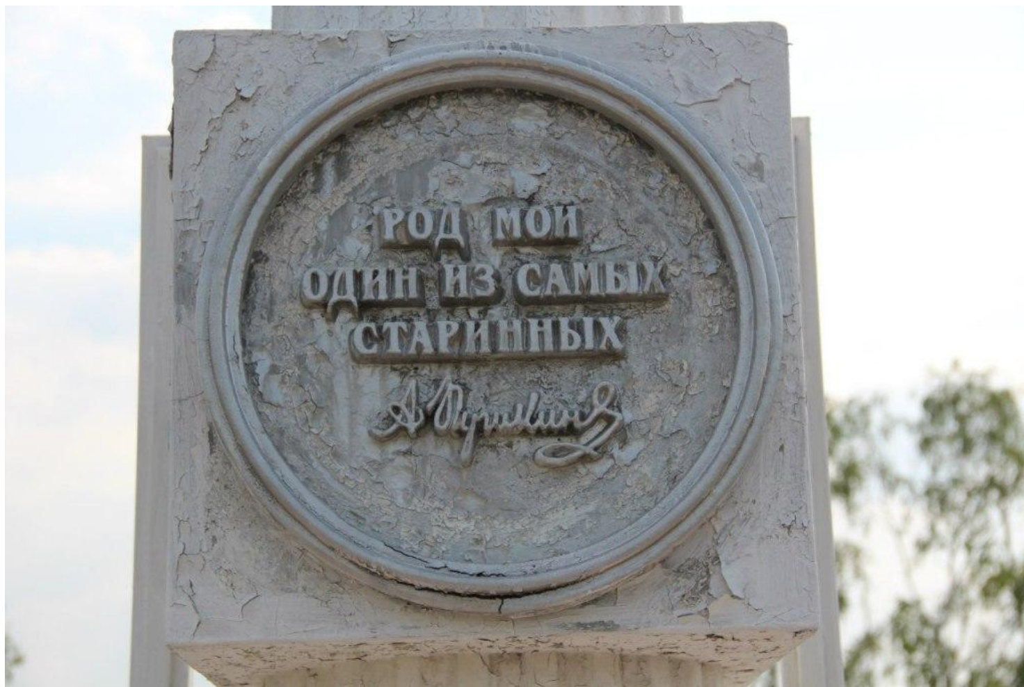
Памятный знак предкам А. С. Пушкина