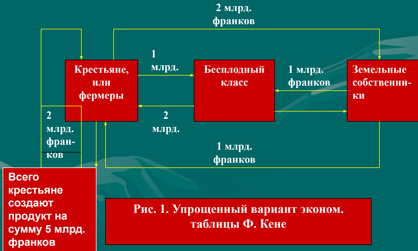
Рис. 1. Упрощенный вариант эконом. таблицы Ф. Кене