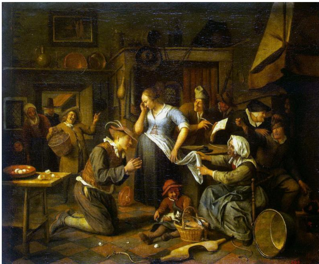
Ян Стен "Брачный договор" 1668 г.