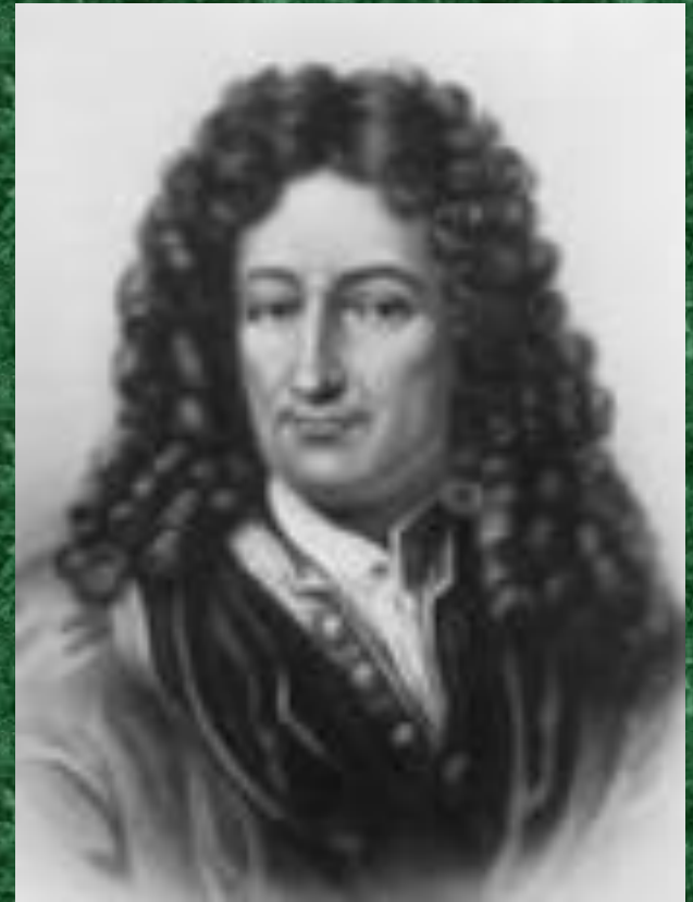
Лейбниц Готфрид Вильгельм (1646 – 1716)