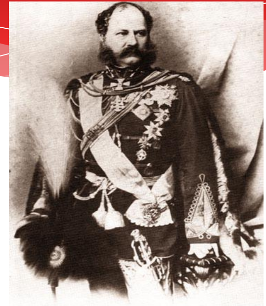
Александр Барятинский - Главнокомандующий Кавказской армией (1856-1862гг.)