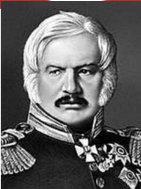
Алексей Ермолов - командующий русскими войсками на Кавказе ( 1816-1827гг.)