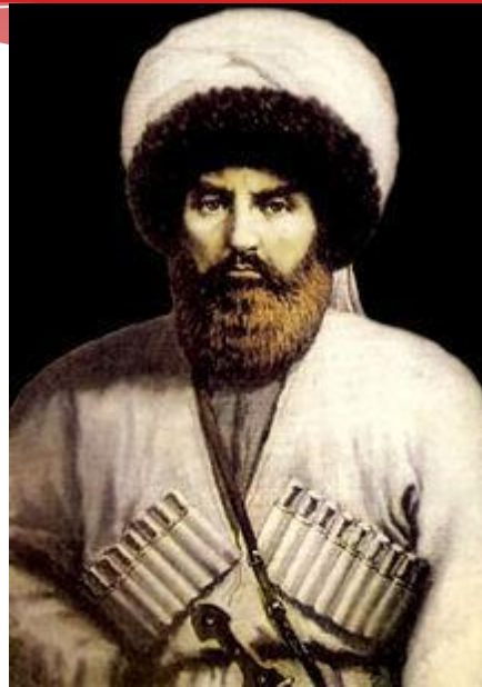
Имам Шамиль - третий имам Дагестана и Чечни (1834-1859гг.).