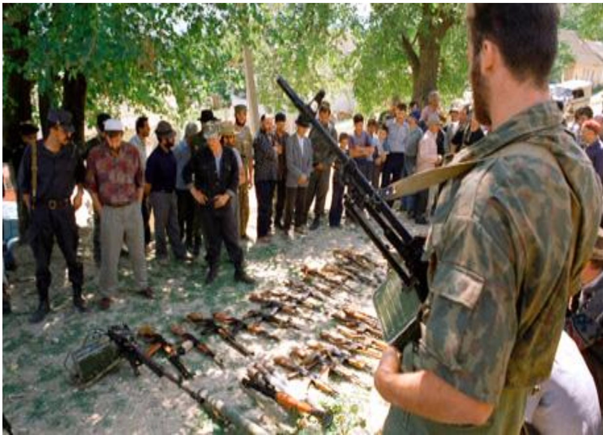
Задержание Участников банд группы Бараева