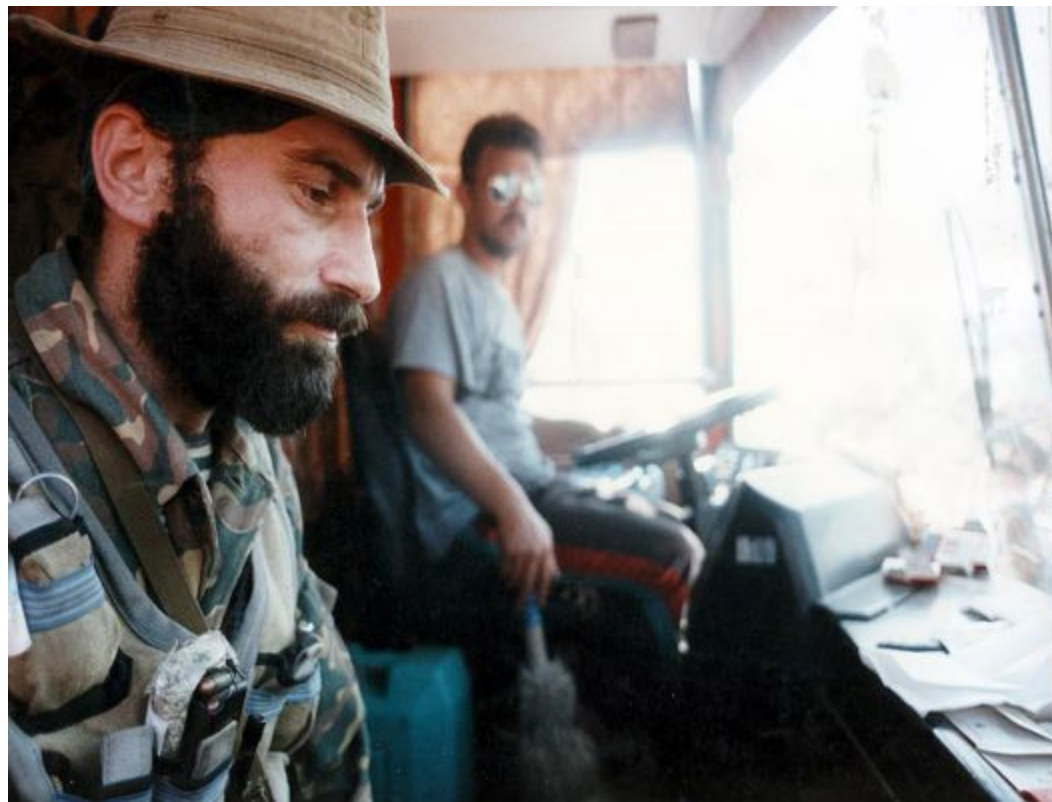
Шамиль Басаев Шамиль Басаев в автобусе с

Общие потери российской стороны, по официальным данным, составили 143 человека (из которых 46 являлись сотрудниками силовых структур) и 415 раненных, потери террористов — 19 убитыми и 20 ранеными.