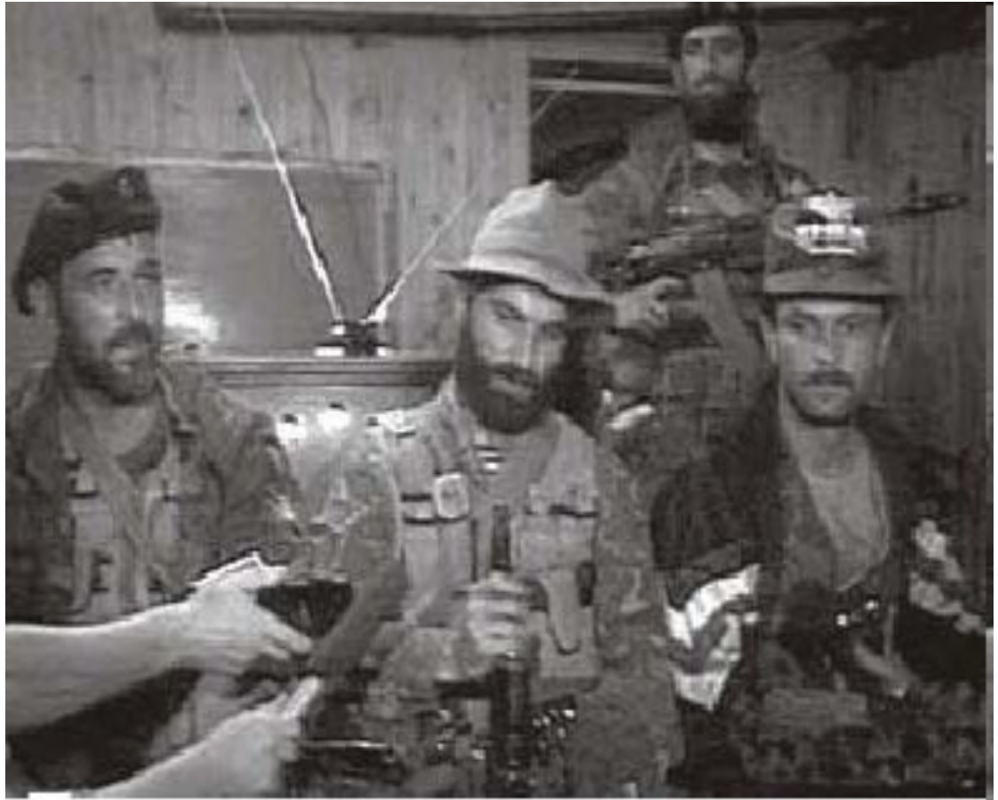
Террористы во время переговоров. В центре - командир отряда Шамиль Басаев. 15 июня 1995 г. г. Буденновск.

• Война сопровождалась акциями взятия заложников. 14 июня 14 июня 1995 года 14 июня 1995 года группа чеченских боевиков численностью 195 человек во главе с полевым командиром Шамилем Басаевым 14 июня 1995 года группа чеченских боевиков численностью 195 человек во главе с полевым командиром Шамилем Басаевым на грузовиках въехапа