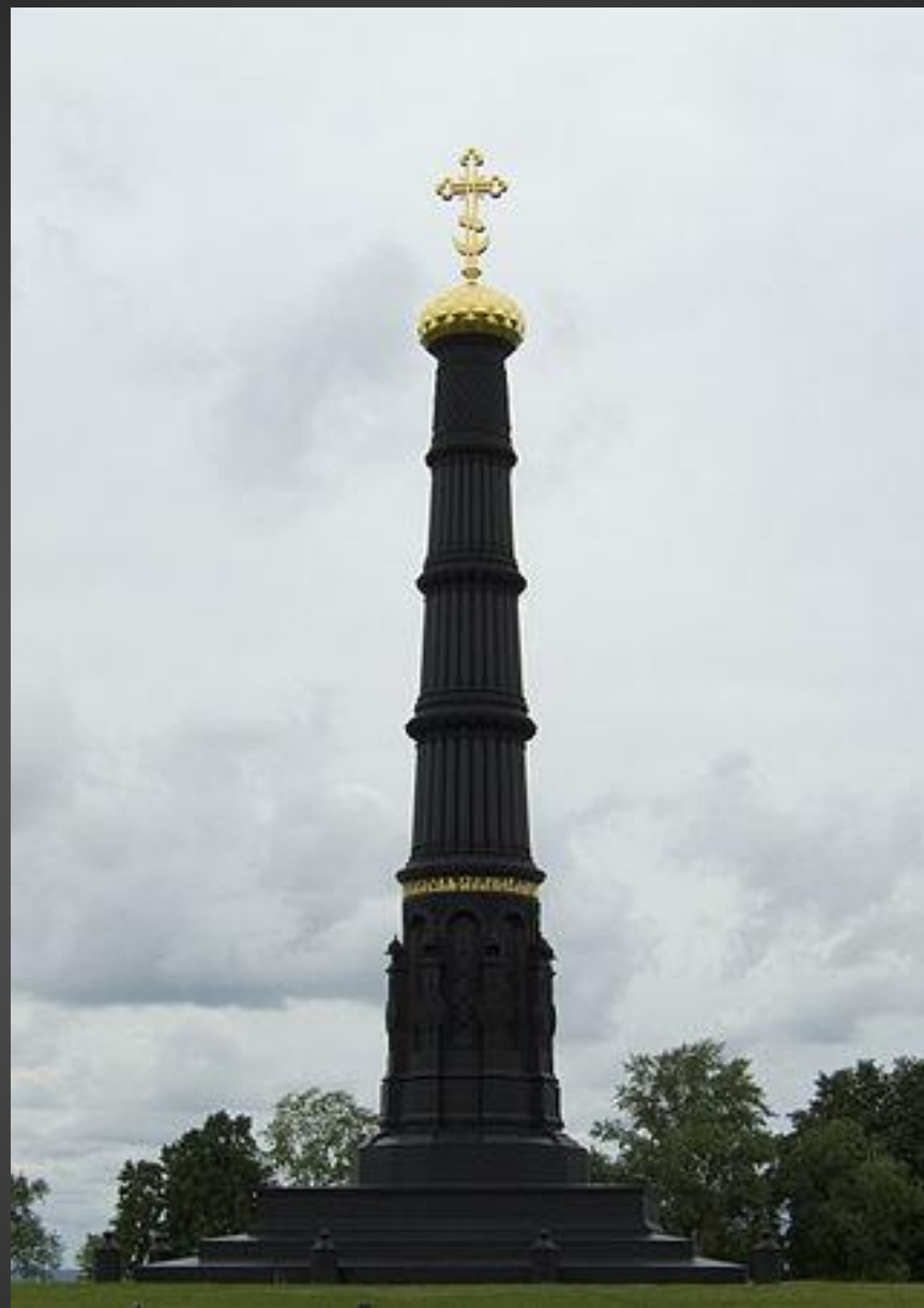
Памятник в честь победы на Куликовом поле по проекту А. П. Брюллова. 1848.