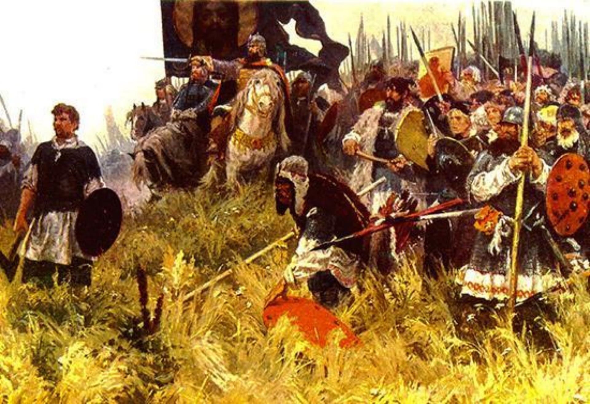
Утро на поле Куликовом. Художник А.П. Бубнов. 1943–1947.