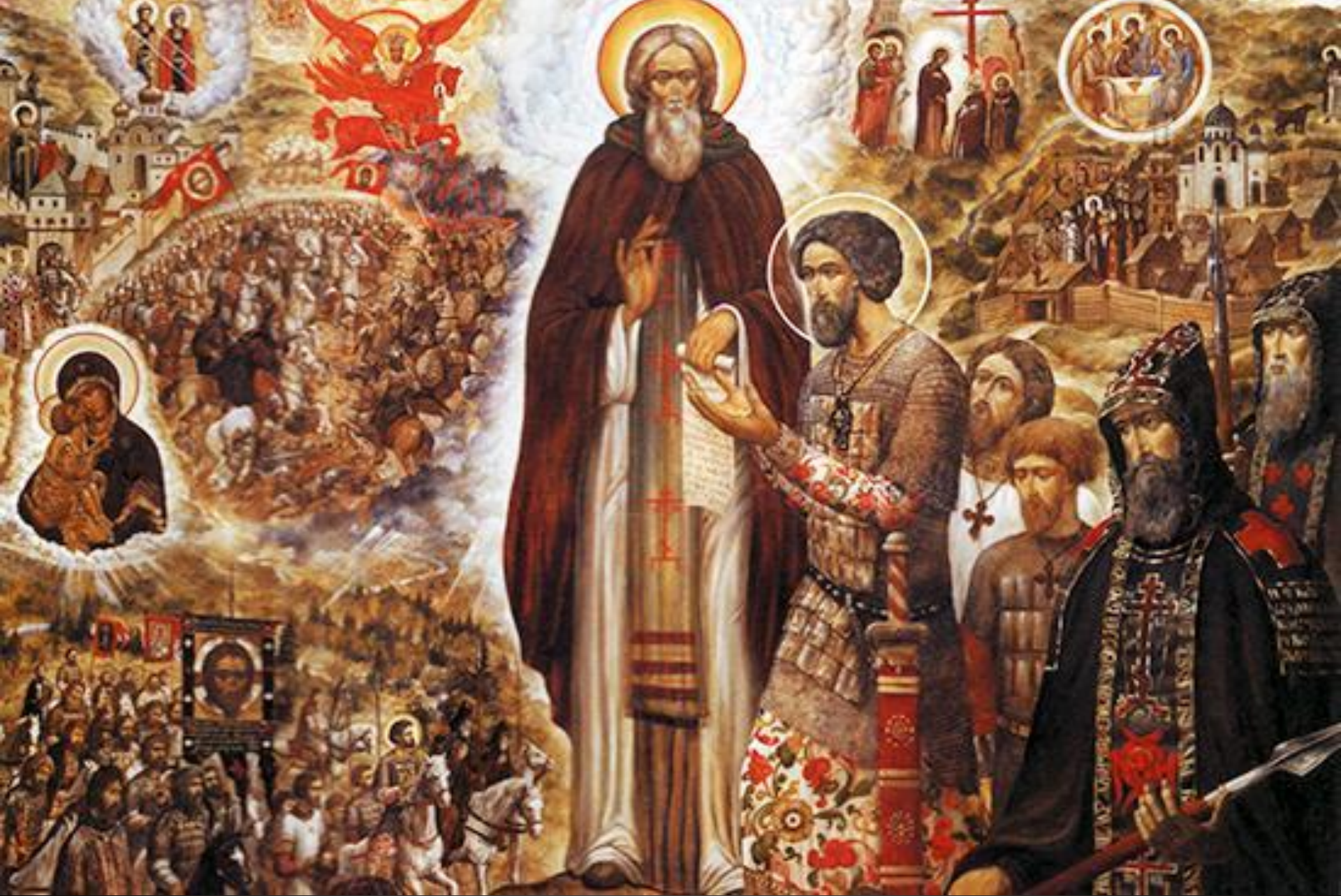
Святой Сергий Радонежский благословляет святого князя Димитрия Донского. Художник С.Б. Симаков. 1988 г.