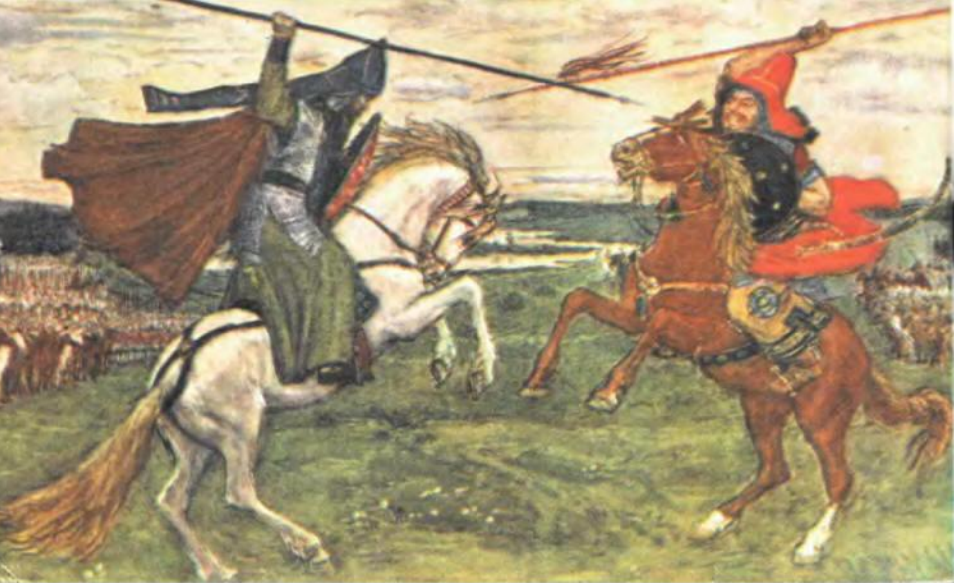
В. М. Васнецов. «Поединок Пересвета с Челубеем»