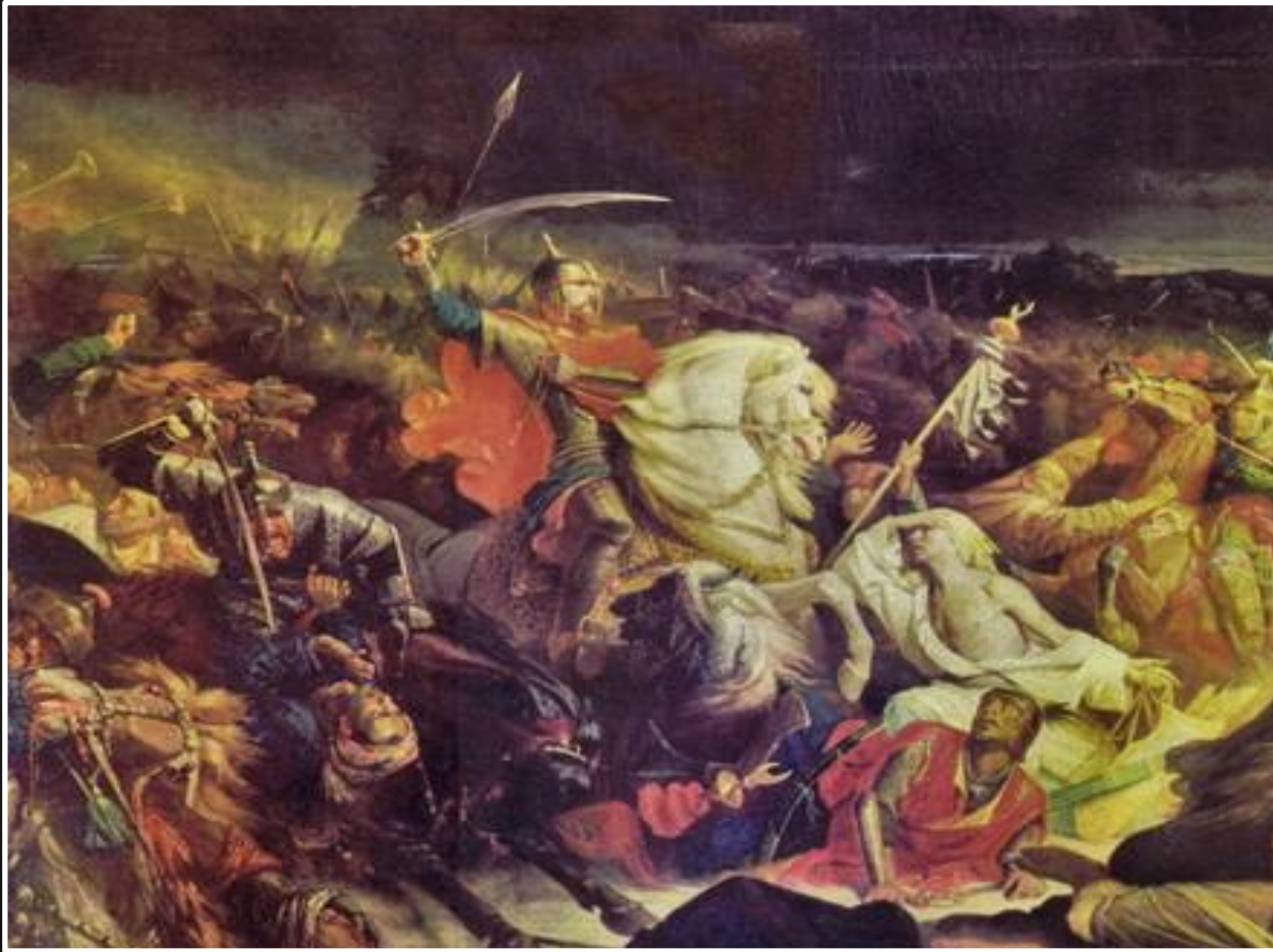
«Куликовская битва», Адольф Ивон (1859)