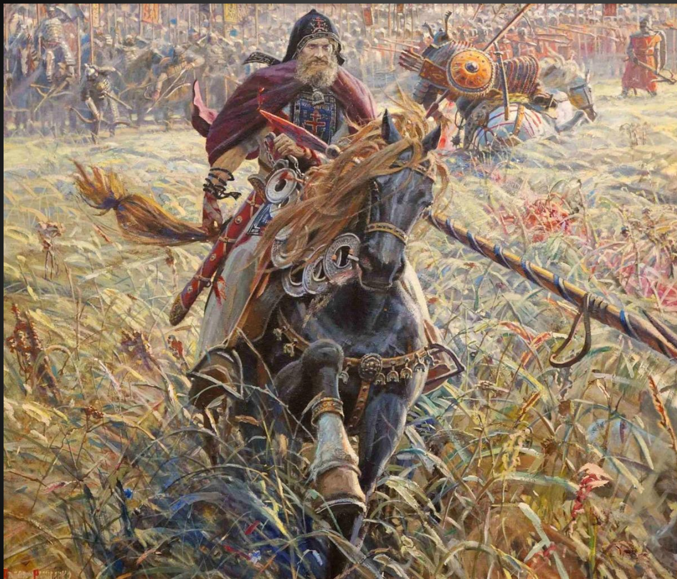
Александр Пересвёт — легендарный монах-воин, инок Троице-Сергиевского монастыря.