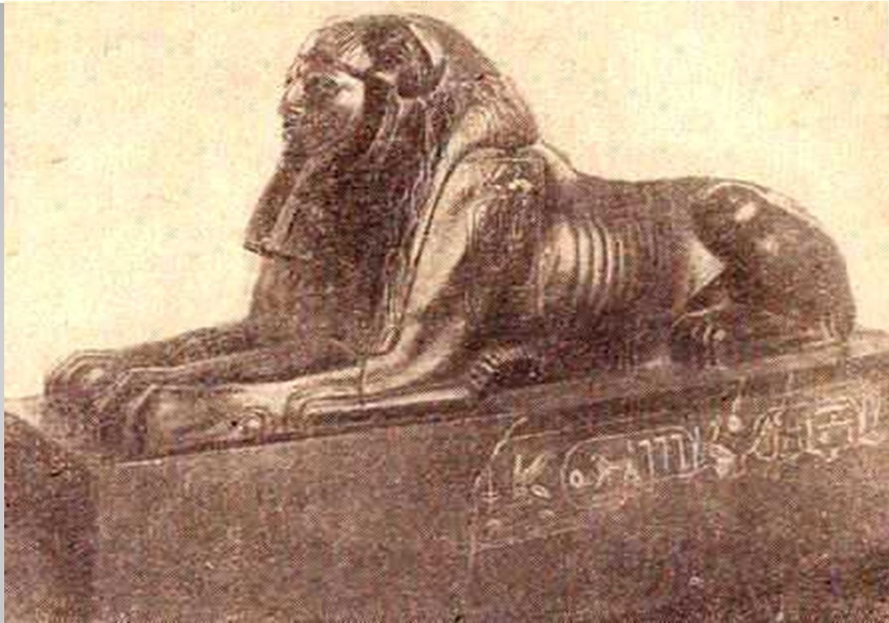
Сфинкс с лицом Аменемхета III – «Танисский сфинкс»