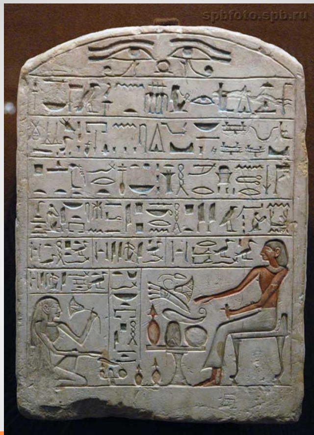
Стела начальника Гончаров Пепи