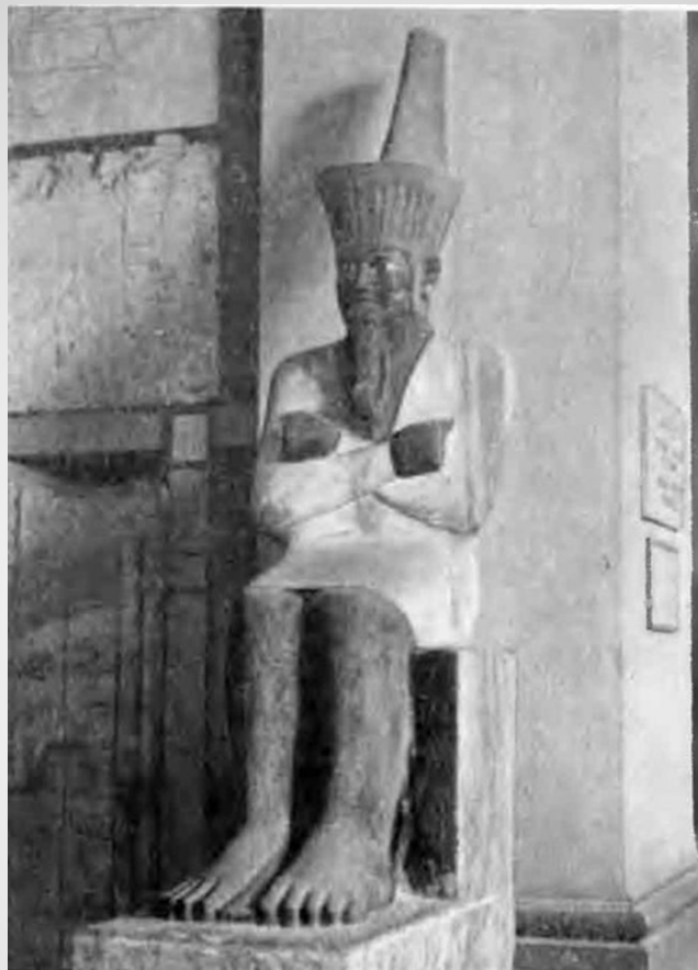
Статуя фараона Ментухотепа I (2060 – 2010 гг. до н.э.) из его заупокойного храма в Дейр-эль-Бахри