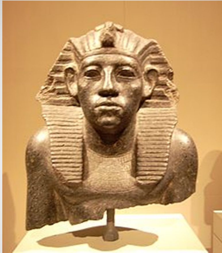
Портретная статуя Аменемхета III (1841 – 1797 гг. до н.э.)