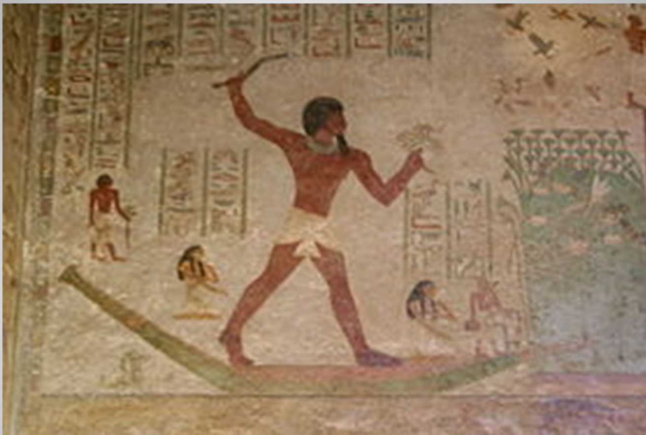
Росписи гробницы Хнумхотепа II в Бени-Хасане