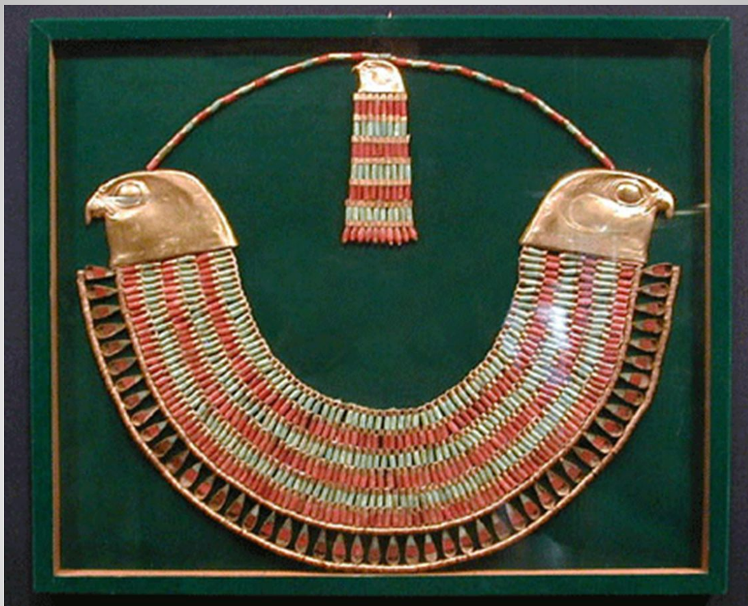
Ожерелье принцессы Неферуптах