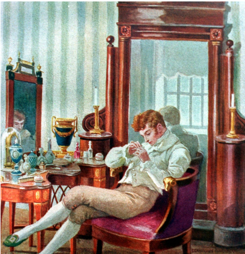
Иллюстрация к «Евгению Онегину» изд. 1911 г. Художница Е. Самокиш-Судковская