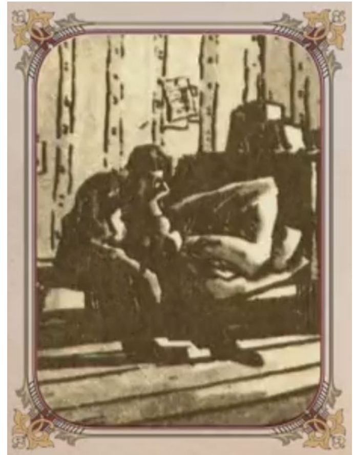
Иллюстрация к «Медному всаднику»