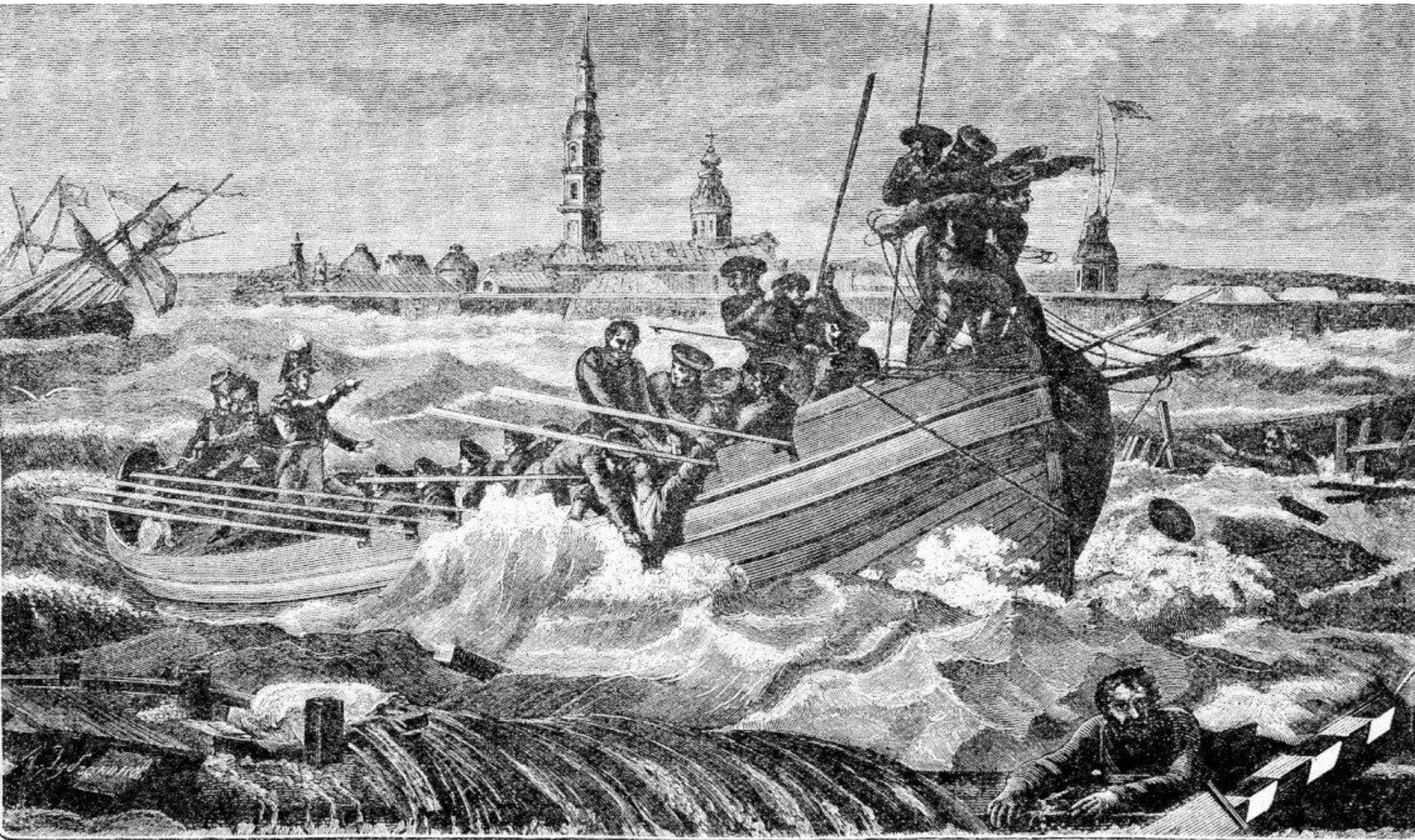
Наводнение въ Петербургѣ 7-го ноября 1824 года.

«Нева металась, как больной в своей постеле беспокойной...»