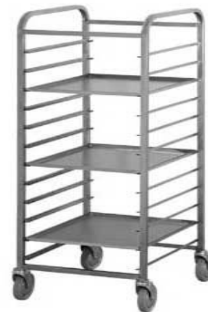
Стеллаж кондитерский передвижной