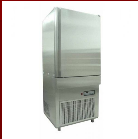
1 секционный холодильный шкаф