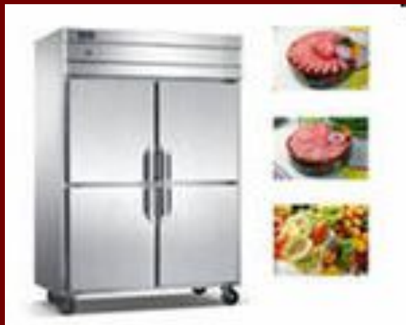
4 секционный холодильный шкаф