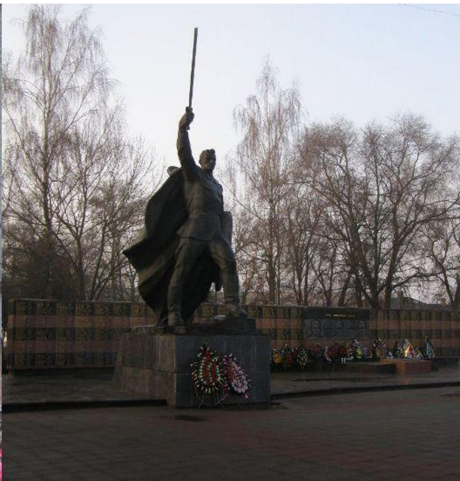
Барельеф Героя в г. Ковель