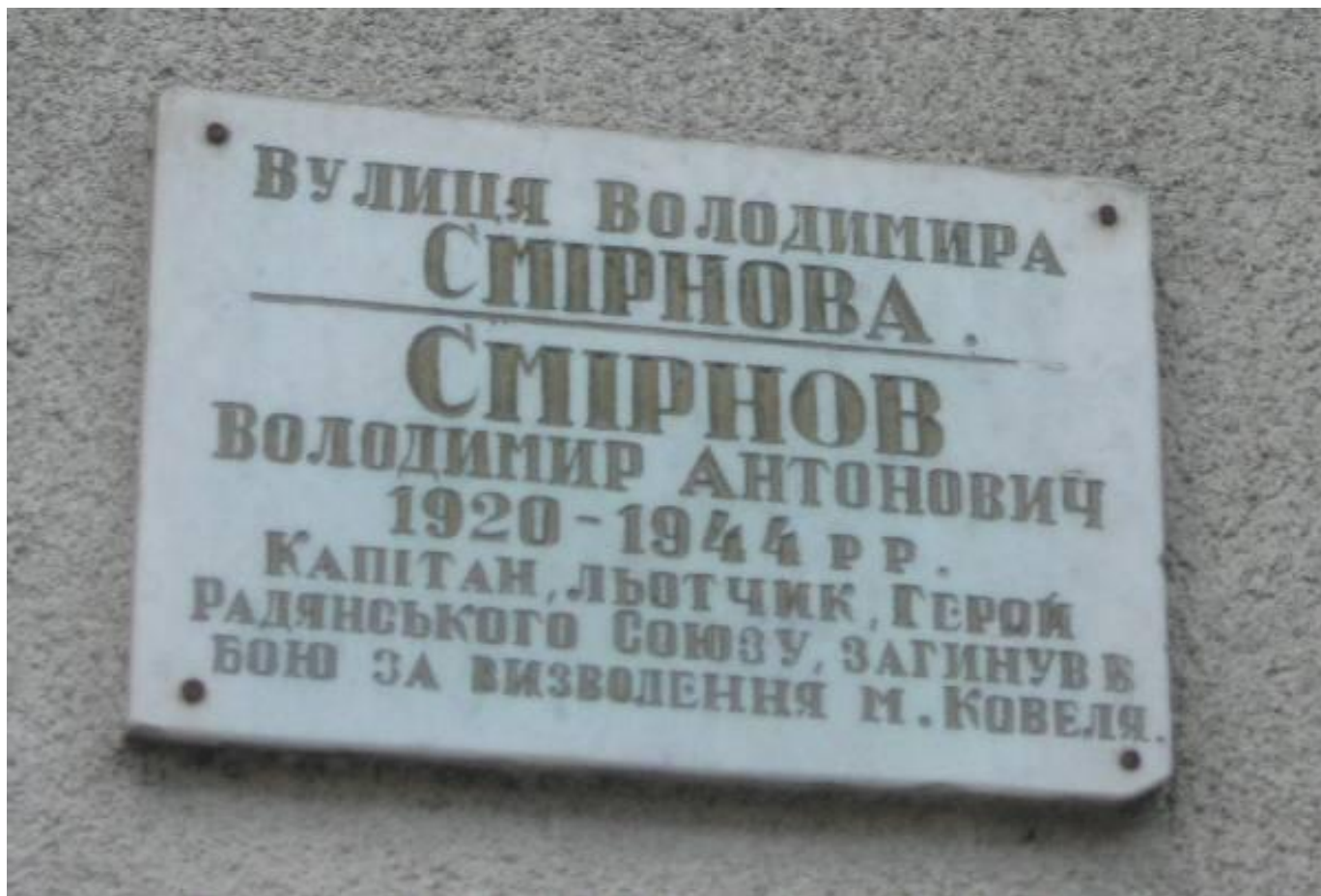
Памятная доска в г. Ковель