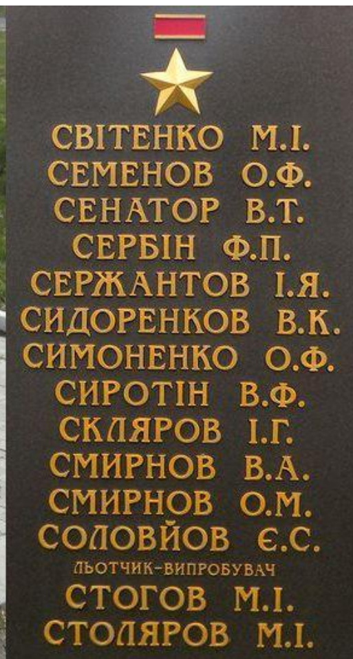
Аллея Героев в г. Чугуев