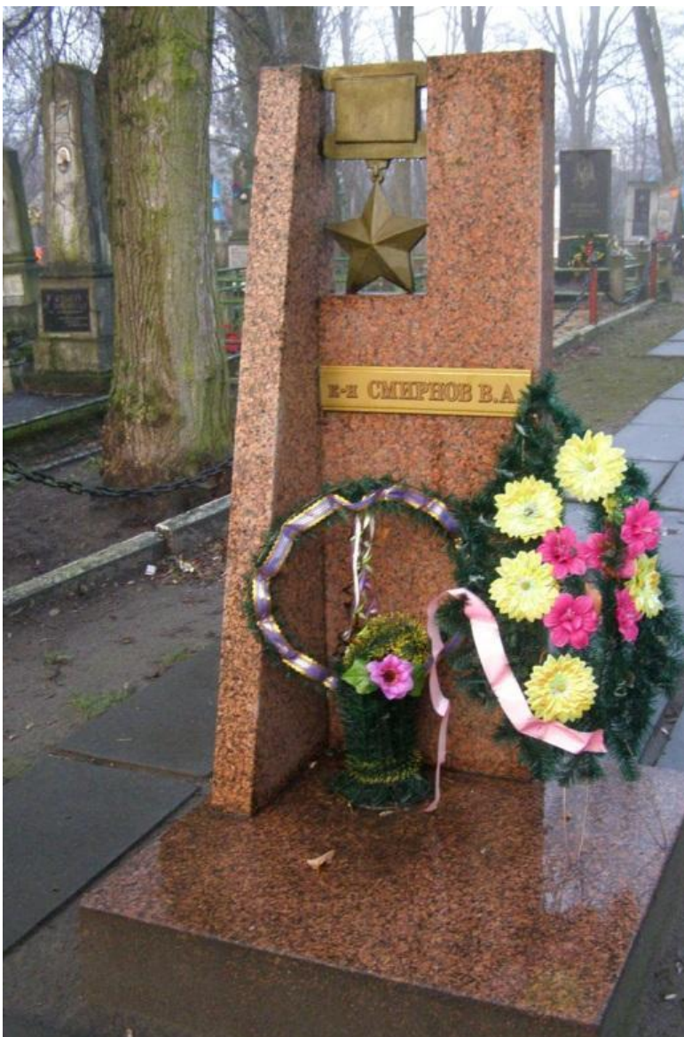
Памятник Герою на его могиле в г. Ковель Волынської області, Україна